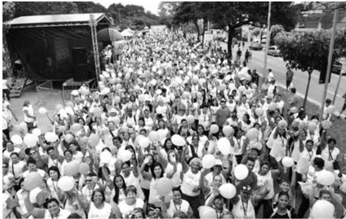
A Secretaria de Esporte espera repetir 2013 e reunir 2.600 mulheres nesta edição da corrida