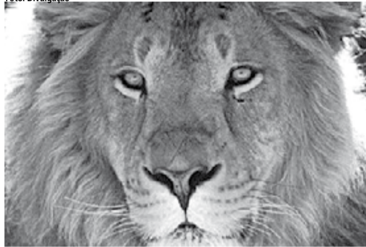
O Imposto de Renda é a preocupação da vez neste início do ano

fiscais de serviços médicos e odontológicos (inclusive internações e gastos com plano de saúde); recibos, notas fiscais ou boletos pagos de despesas com educação do contribuinte ou de dependentes; comprovantes de contribuição previdenciária para empregados domésticos com carteira assinada; boletos pagos de alu-