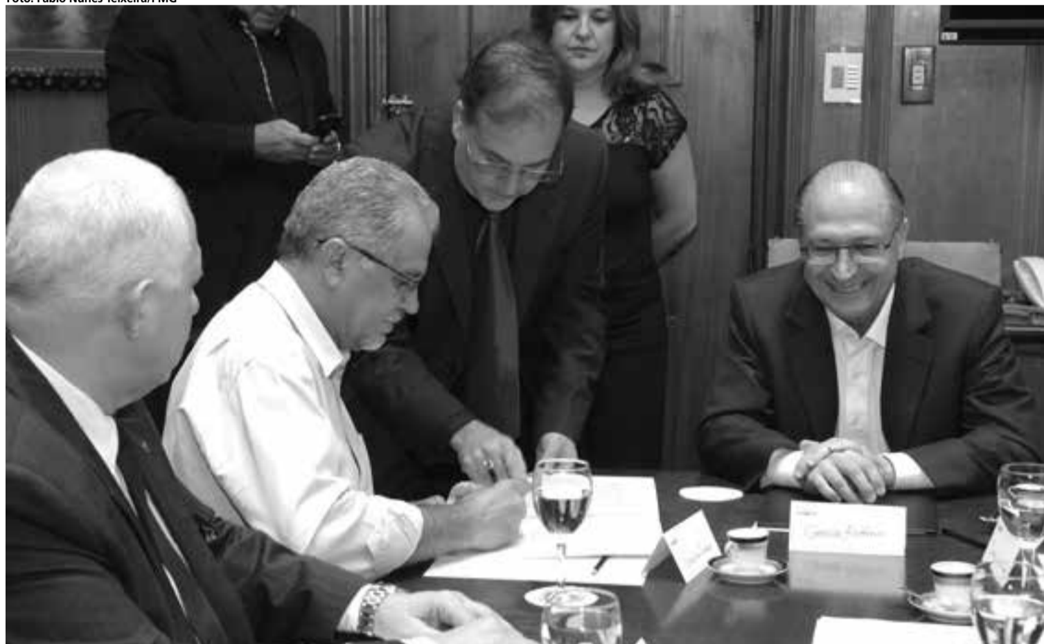
A transferência da área de 267 m 2 foi oficializada na última quinta-feira (20), em cerimônia no Palácio dos Bandeirantes