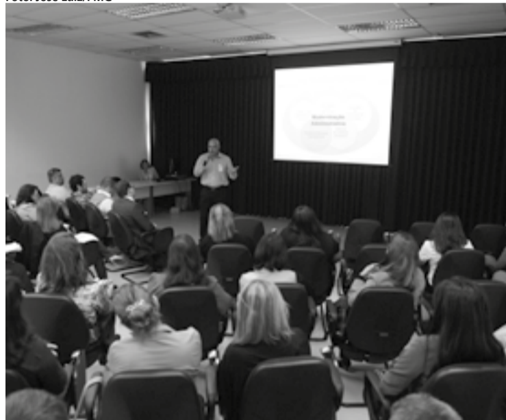
As palestras serão realizadas à tarde no Adamastor Centro

dará o atendimento ao público em sua área de atuação.