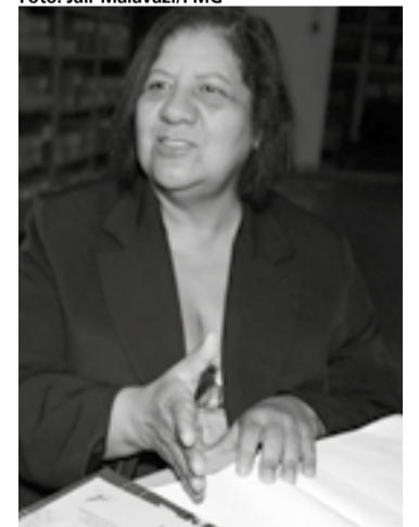
Araci adora cuidar do acervo

destinação após esse período). Então pesquisei quem eram os 'papas' da Arquivologia no Brasil", conta ela, que entrou no Instituto de Estudos Brasileiros da USP.