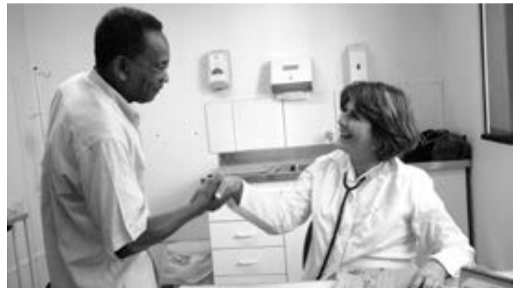
Pesquisa da UFMG mostra aprovação a médicos cubanos