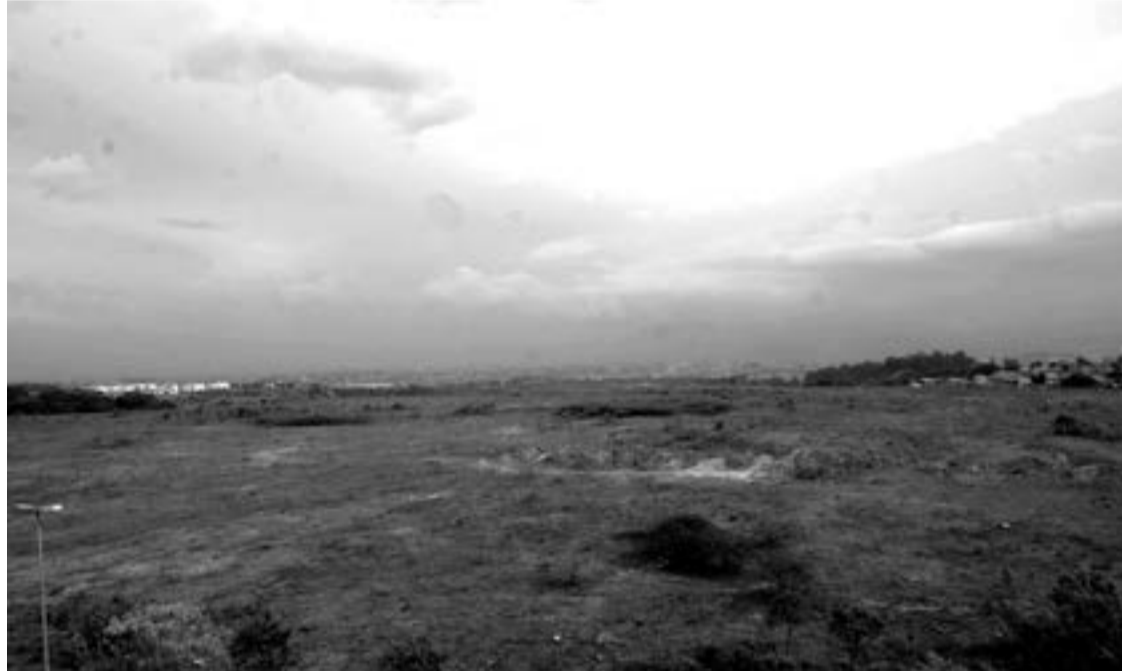
O Parque Tecnológico de Guarulhos será construído numa área de 268 mil m², na região de Cumbica

A Prefeitura vem desempenhando um papel fundamental em todo esse processo. Começando pela aquisição da área de 268 mil m² para a implantação do Parque Tecnológico. Ela recebeu um terreno de 126 mil m² em troca da quitação de dívidas da empresa estatal Dersa, num total de R$ 29,7 milhões. O acordo também garantiu outros 142 mil m² para o projeto, por meio de uma cessão de uso válida por 90 anos com o Governo do Estado.