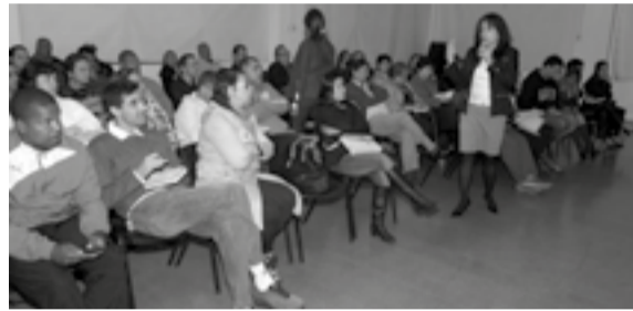
A Prefeitura realizou encontros sobre o novo regime

artigo nº 39, e à Lei Orgânica do Município, em seu artigo nº 19.