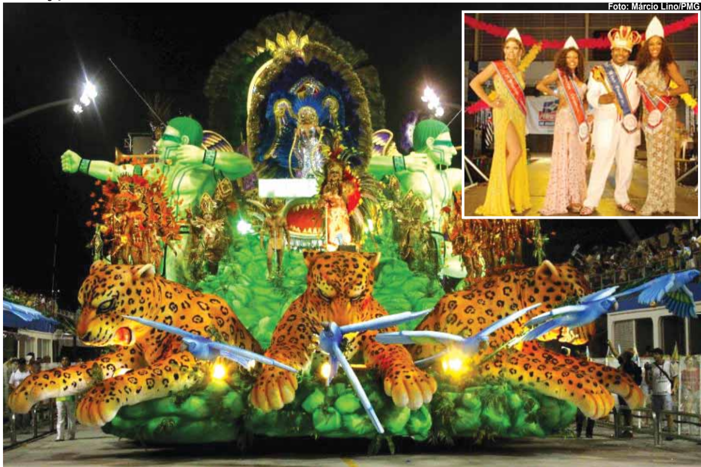
► Exibição da tradicional escola paulistana contará com a Corte Oficial do Carnaval 2011 (no detalhe)