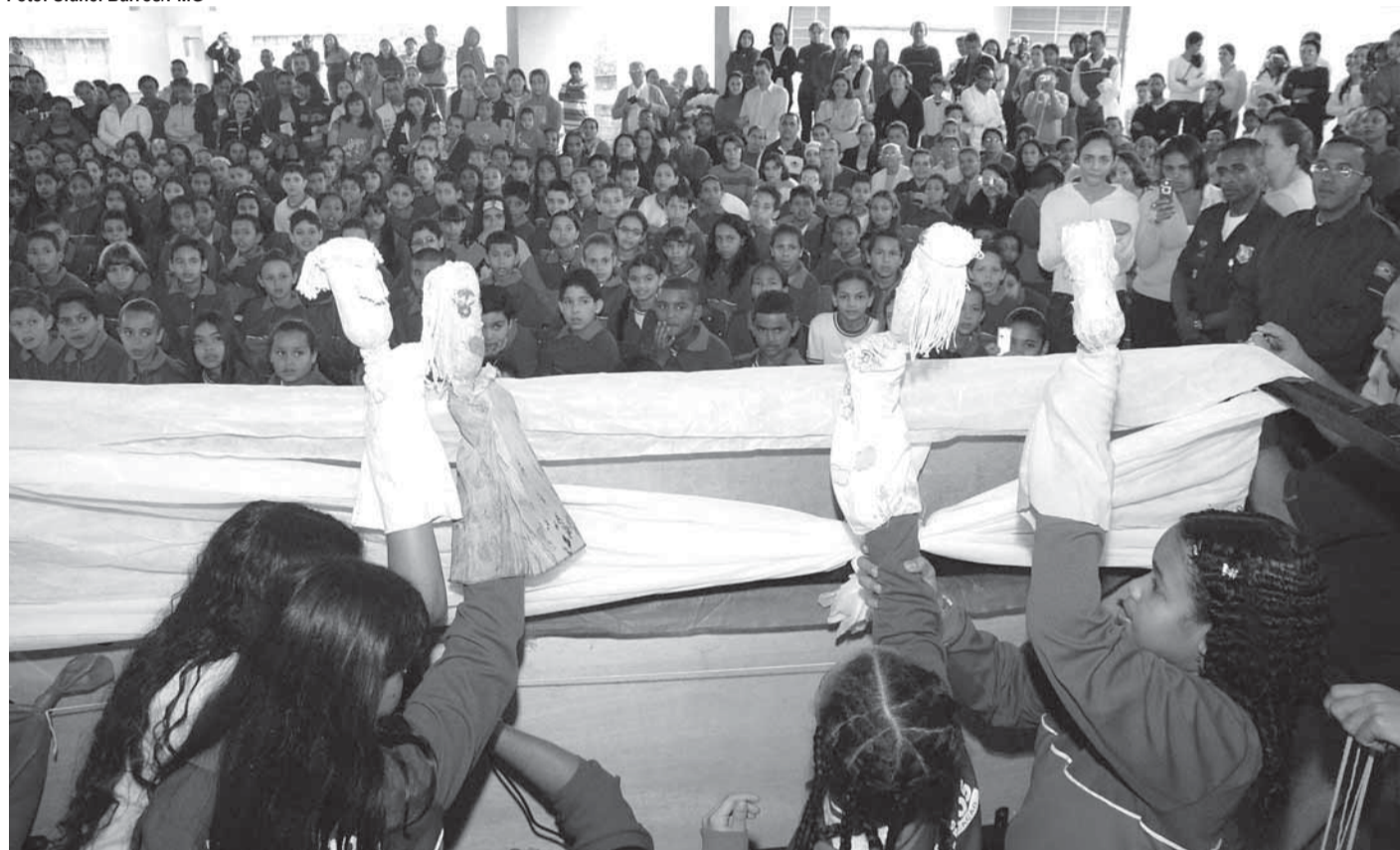
▶ Teatro de fantoches está entre as atividades que o Guard utiliza para alertar as crianças sobre o perigo das drogas