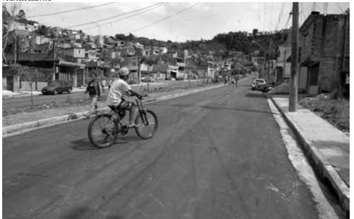
Fim de embargo judicial permitiu o asfaltamento e outras melhorias na principal via do bairro