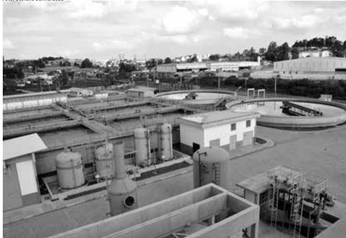
Estações de Tratamento de Esgoto, instaladas a partir de 2010, ajudaram a melhorar o saneamento

Bonsucesso e Várzea do Palácio, respectivamente, em setembro de 2010, dezembro de 2011 e junho de 2014.