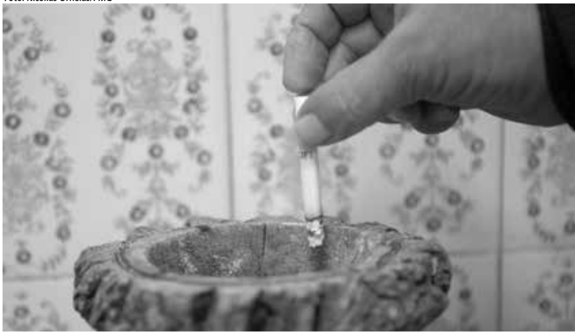
Segundo a Organização Mundial da Saúde, tabagismo é a principal causa evitável de mortes no mundo