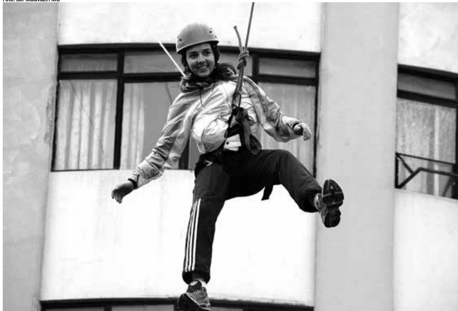
Tirolesa instalada no calçadão da rua Dom Pedro II, no Centro, foi uma das atrações que mais atraiu a atenção dos participantes

participantes destes e também dos locais que promoveram atividades por conta própria foi repassado por telefone, das 9 às 21h, à Secretaria de Esporte, Recreação e Lazer, que o retransmitiu ao Sesc