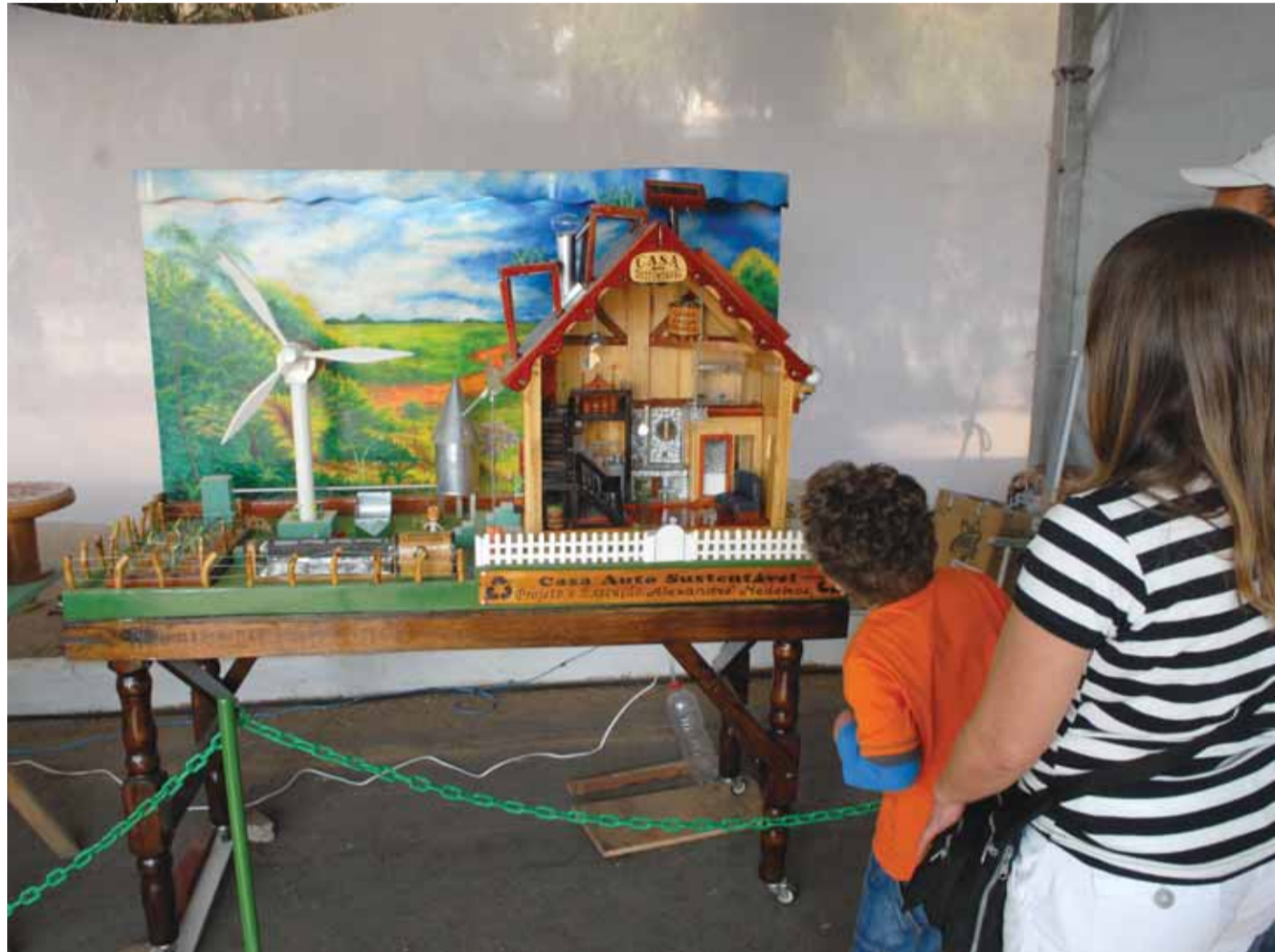
► A exposição da Casa Autossustentável é uma das atrações programadas para esta quarta-feira (1º), no Centro