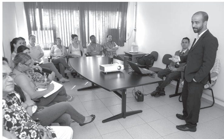
Programação para o servidor inclui palestras motivacionais