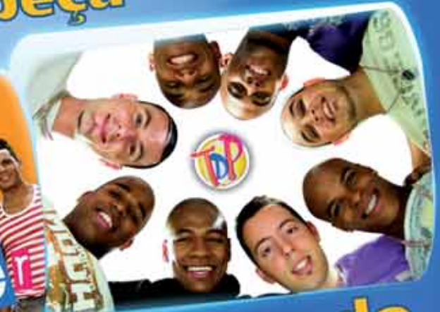
Turma do Pagode