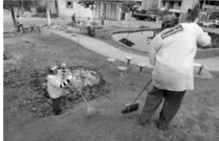
Acúmulo de lixo também pode causar a proliferação de insetos

jeito, 639 m³ de volumosos e 1.551 unidades de pneu.