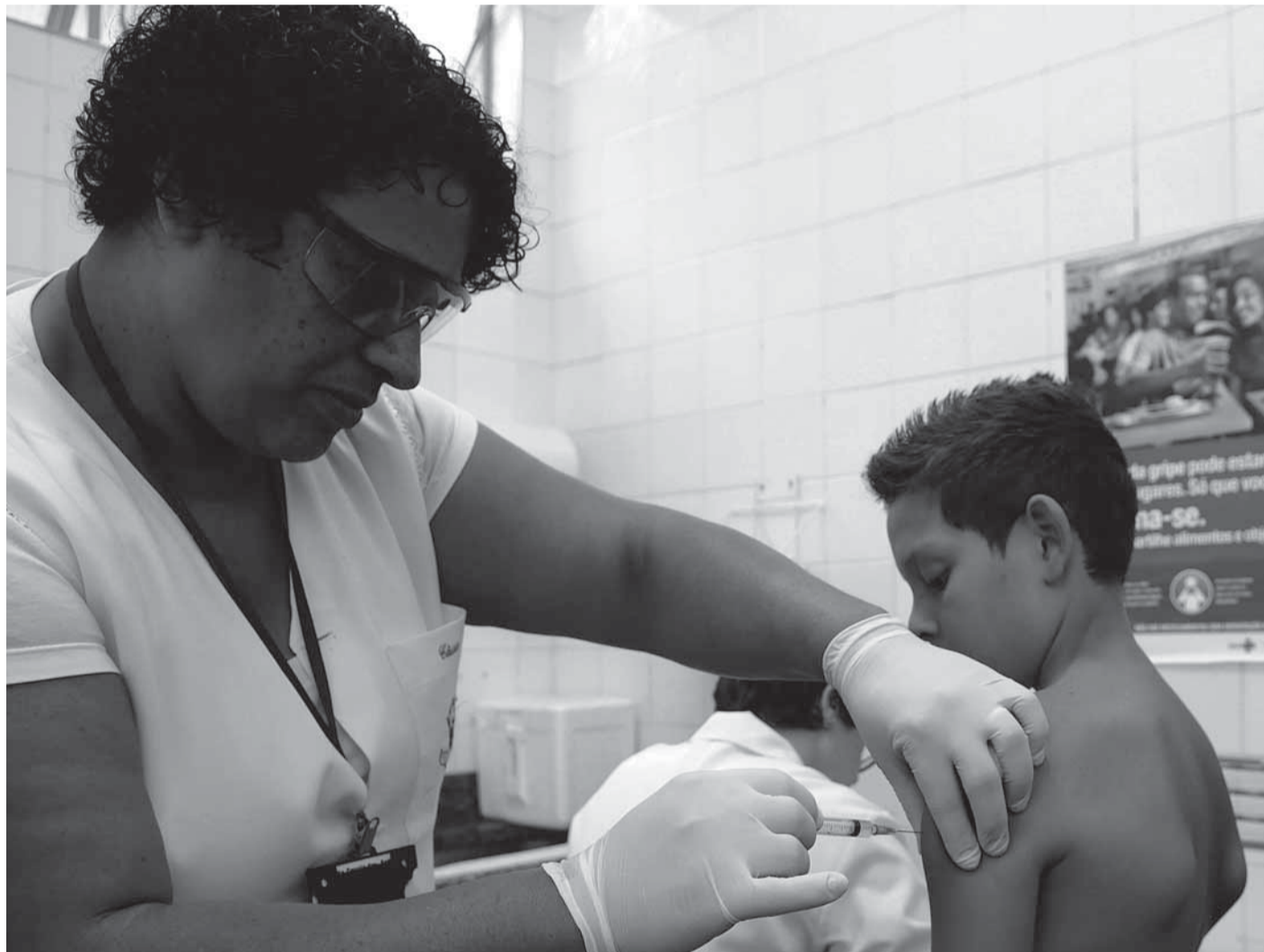
▶ Vacina, que também protege contra a caxumba e a rubéola, estará disponível nas Unidades Básicas de Saúde