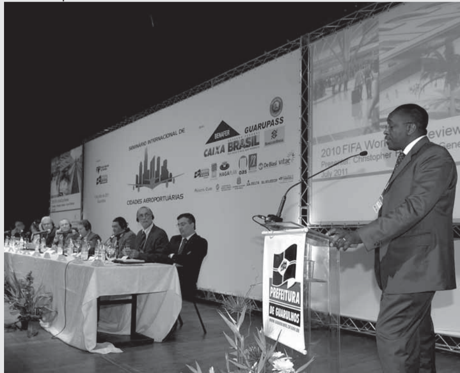
▶ O sul-africano Christopher Hlekane falou sobre a experiência da Copa 2010