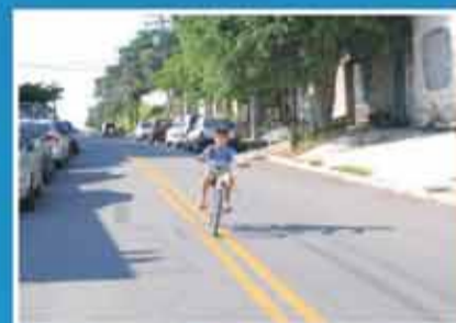
Pavimentação e recapeamento