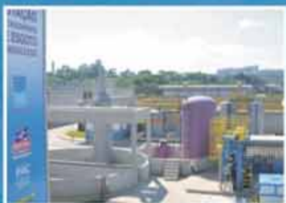
Entrega da ETE Bonsucesso

No aniversário de 451 anos de Guarulhos, a Prefeitura entrega obras importantes e apresenta uma programação imperdível de shows para você comemorar.