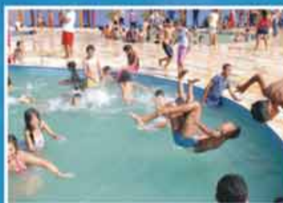
Primeira fase de 3 novos CEUs