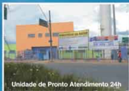
Unidade de Pronto Atendimento 24h