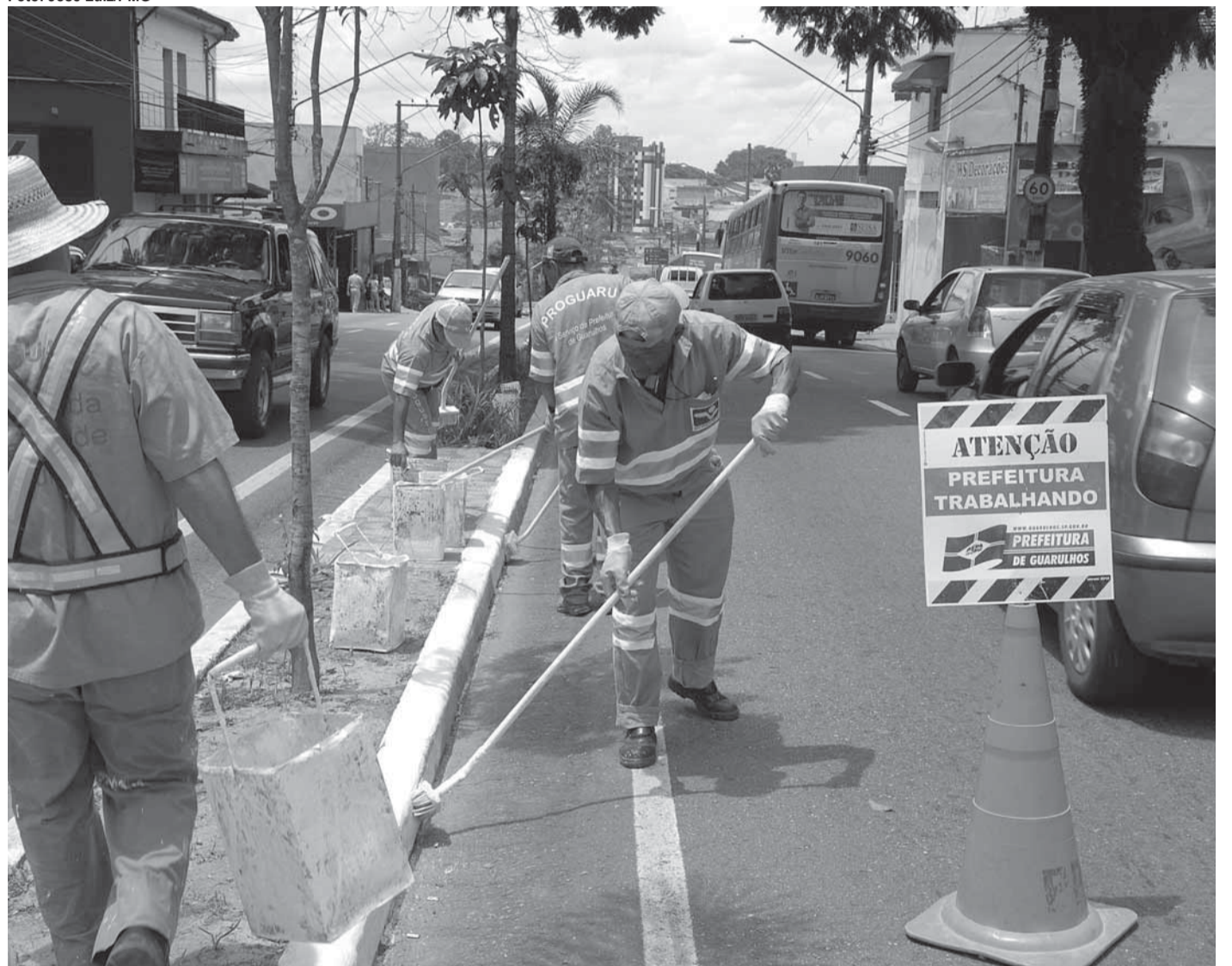
▶ Reposição vale também para os funcionários da Proguaru, Saae, Ipref, aposentados e pensionistas estatutários