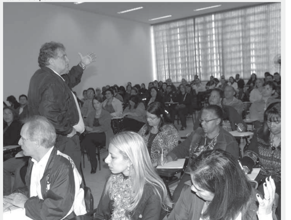
▶ Vagas são limitadas e servidor deve aguardar a confirmação da matrícula

O Programa de Formação do Servidor e Servidora recebe até segunda-feira (14) pré-inscrições de interessados em participar dos seguintes cursos: Administração do Tempo (8 horas), Técnica de Apresentação em Público (14 horas), Gestão de Orçamento (30 horas), Atendimento ao Público (16 horas) e Coordenação de Atividades em Grupo (16 horas). A adesão prévia deve ser feita no site www.guarulhos.sp.gov.br , acessando o link Treinamentos no Portal do Servidor.