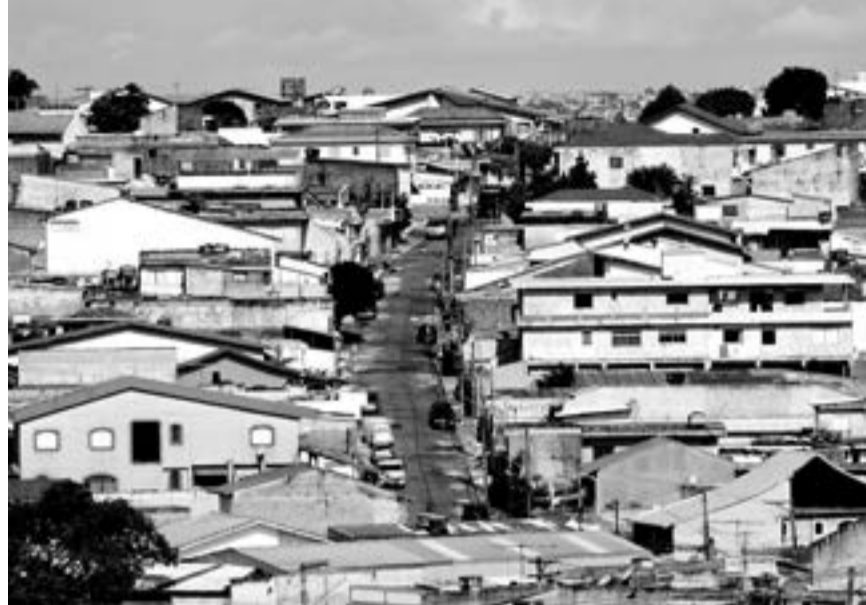
Melhoria no sistema de cadastramento de imóveis auxiliou na arrecadação

to escolhidas pelos contribuintes para pagamento do imposto manteve-se praticamente estável. Neste ano, 32,5% optaram por quitar o IPTU com cota única, aproveitando assim o bônus de 10% concedido pela Prefeitura para os pagamentos à vista até a data limite estipulada nos carnês. Em 2014, o índice dos que preferiram essa forma de quitação do imposto foi de 32,4%.