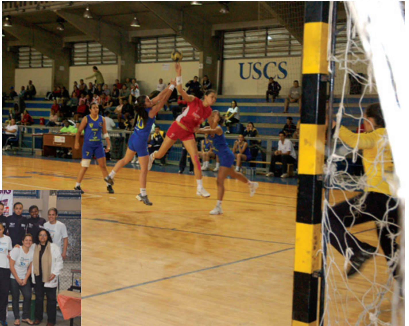
▶ A equipe feminina de handebol ficou com o título ao vencer Franca na final