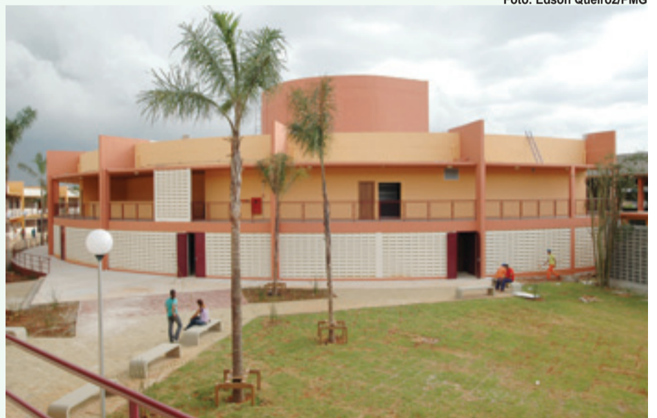
▶ O evento será realizado no Teatro Adamastor Pimentas