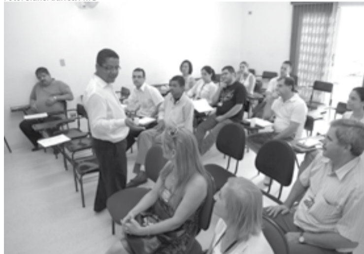
Programa pretende tornar o ambiente de trabalho mais seguro

será voltado às novas chefias designadas em abril e maio deste ano.