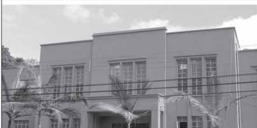
Teatro Padre Bento restaurado e modernizado