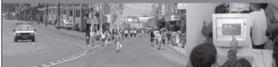
Pavimentação em diversas ruas D. Pedro II exclusiva para pedestres Inclusão digital em 63 escolas

Para mais informações, acesse: www.guarulhos.sp.gov.br