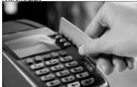
Via eletrônica moderniza o sistema