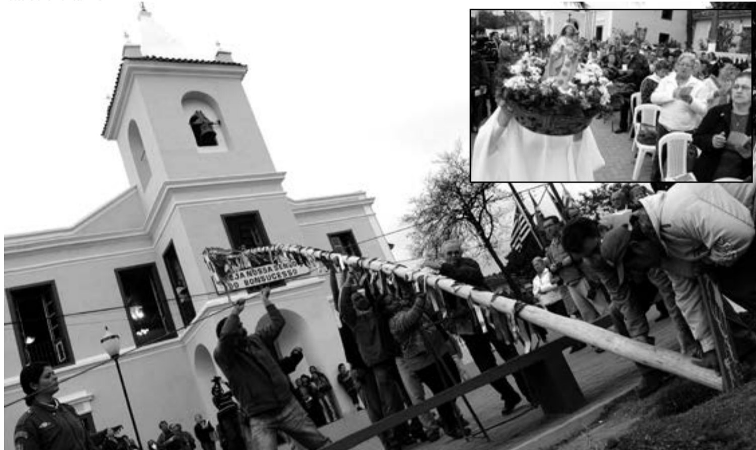
Na segunda-feira, às 7h30, acontece a cerimônia de plantio do mastro da festa, em frente ao Santuário de N. Sra. de Bonsucesso

com bênção da terra, às 8h. Às 10h30 haverá missa de coroação da santa e às 14h30 e 19h30 mais duas celebrações eucarísticas.