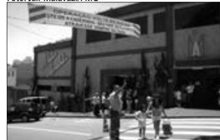
A operação prossegue até o dia 14