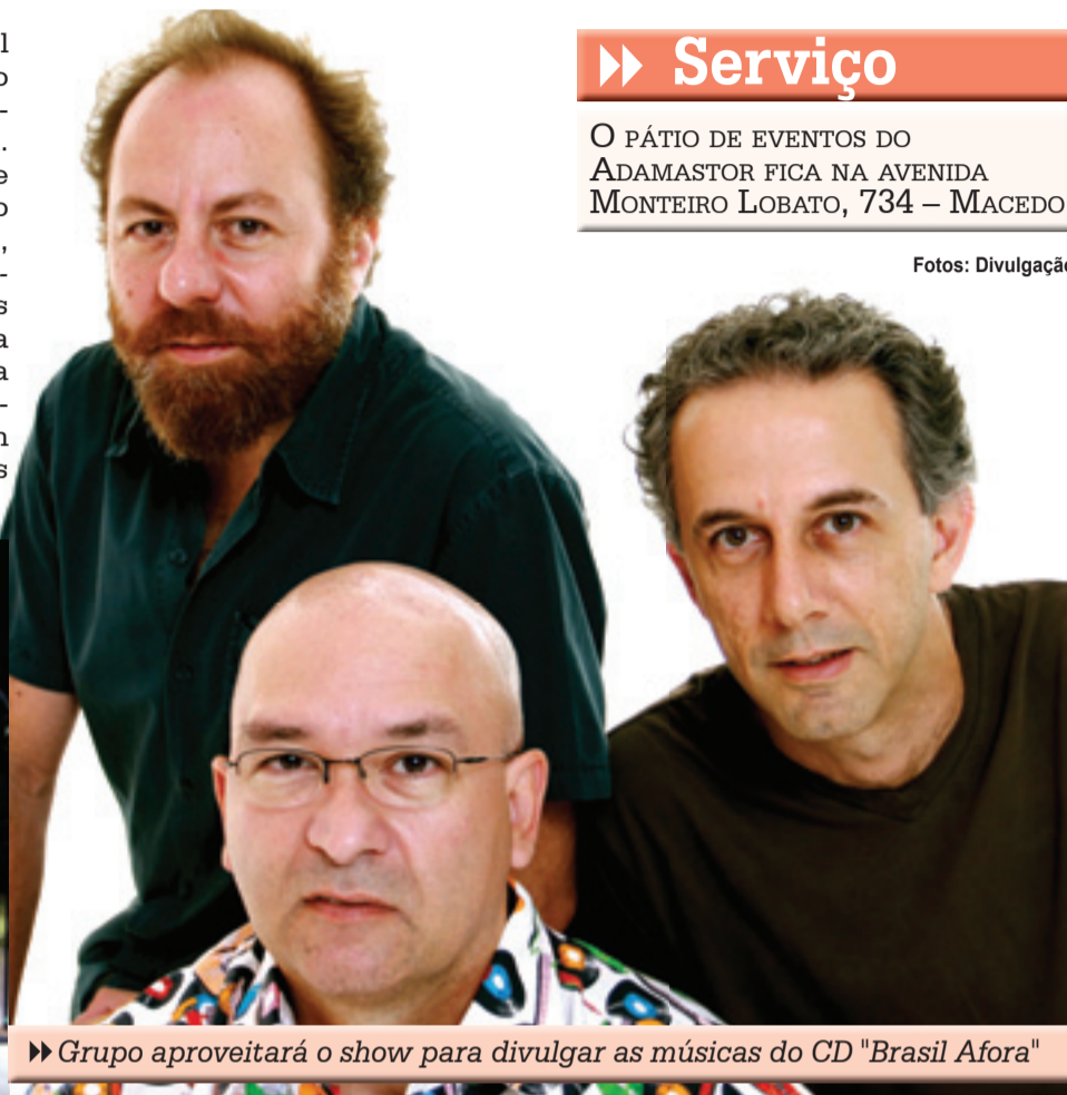
▶ Grupo aproveitará o show para divulgar as músicas do CD "Brasil Afora"