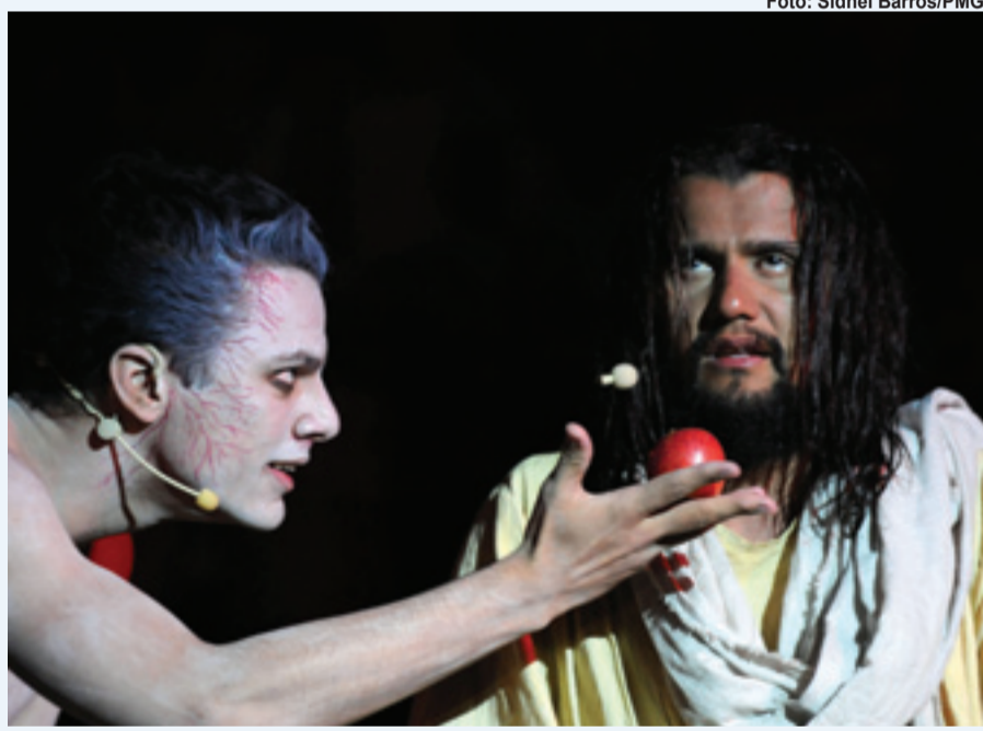
▶ O espetáculo terá três horas de duração e reunirá 380 integrantes

Durante a encenação, a Prefeitura arrecadará alimentos para o Fundo Social de Solidariedade, que fará a distribuição às famílias assistidas pelo órgão. Quem quiser contribuir basta doar um quilo de alimento não-perecível (exceto sal e açúcar).