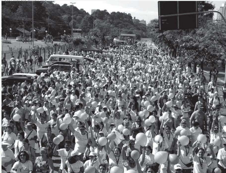
► Em sua 12ª edição, prova será realizada no último domingo de março