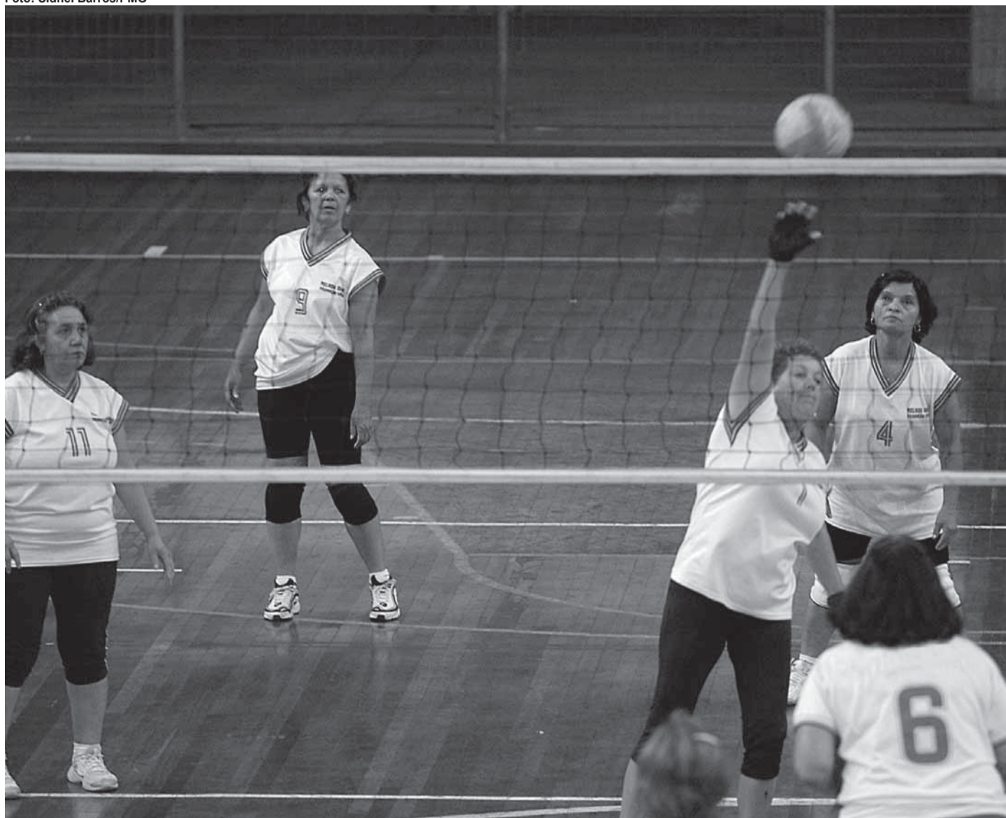
► Festival de Voleibol Feminino da 3ª Idade deverá reunir 100 participantes no próximo dia 17, no João do Pulo