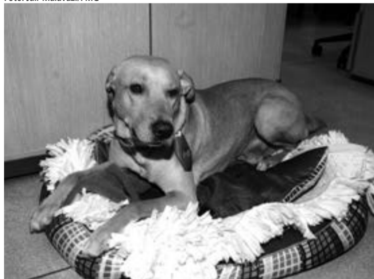
"Costela", sempre limpinho e cheiroso, leva alegria ao local