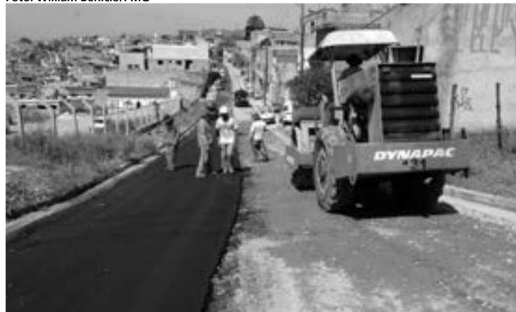
A rua Mário Luiz Maca (acima e ao lado) é uma das que estão recebendo as melhorias; a ação beneficia 513 famílias em todo o bairro

De acordo com a Prefeitura, essas intervenções fazem parte de um conjunto de obras de infraestrutura que hoje atende diversas regiões da cidade. Até o final do ano, muitas outras ruas receberão pavimentação.