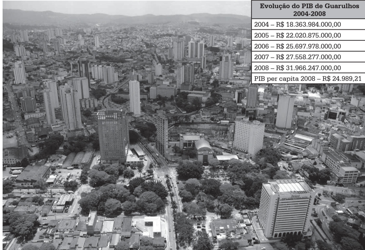
Evolução do PIB de Guarulhos 2004-2008 2004 R$ 18.363.984.000,00 2005 R$ 22.020.875.000,00 2006 R$ 25.697.978.000,00 2007 R$ 27.558.277.000,00 2008 R$ 31.966.247.000,00 PIB per capita 2008 – R$ 24.989,21

► No Estado de São Paulo, Guarulhos ficou atrás apenas da Capital, primeira colocada entre os municípios