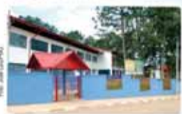
4 novas escolas