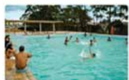
CEU Guarulhos Bambi - 1ª fase