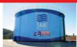
5 novos reservatórios de água

Nesta edição foram distribuídos R$ 34 mil em prêmios, além de medalhas para todos os inscritos.