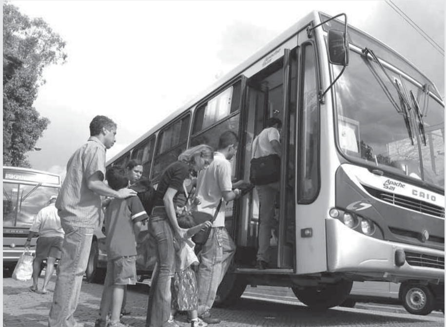
▶ Não haverá mudança no itinerário nem no horário de partida das linhas