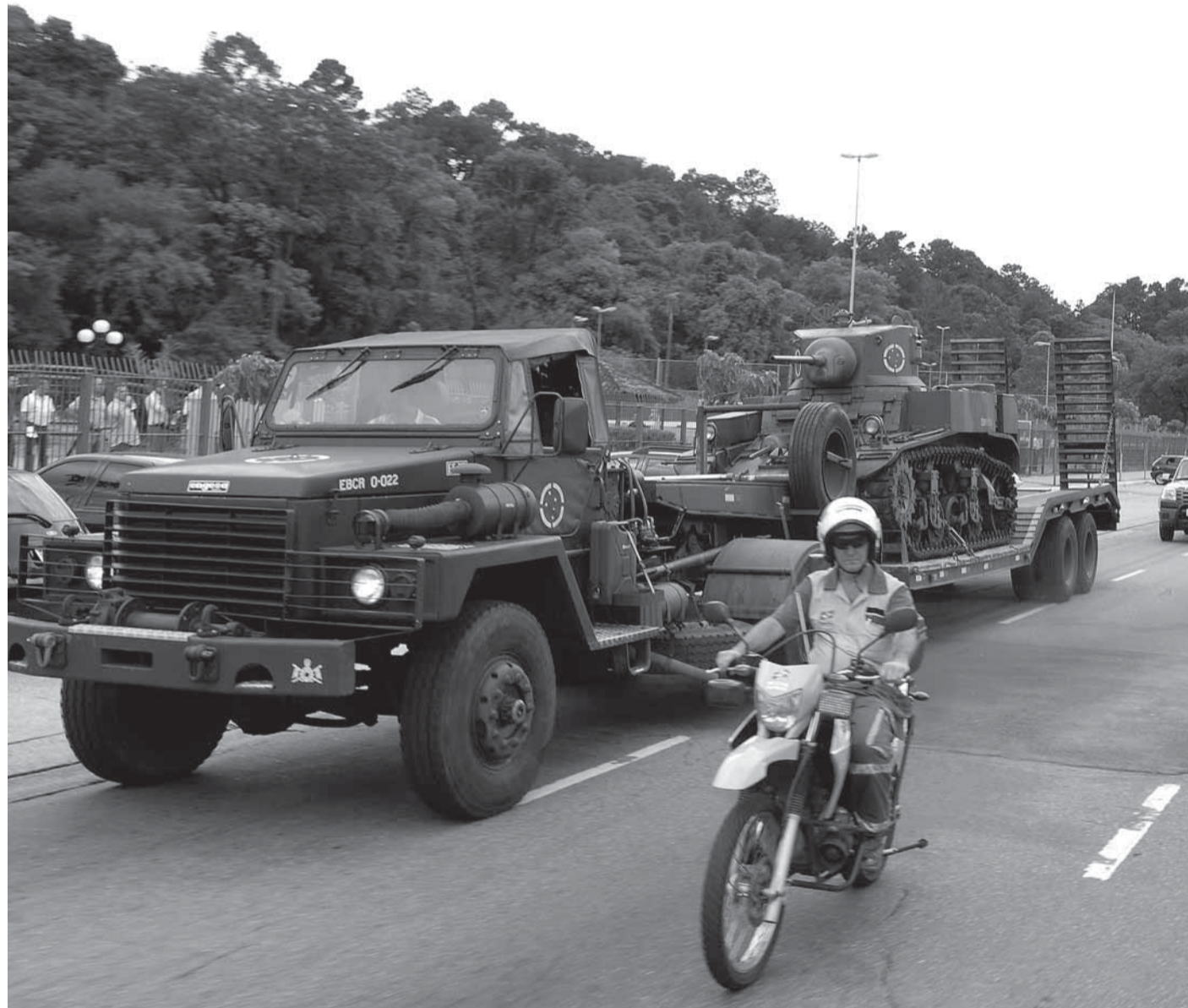
▶ Nesta quinta-feira (2), um tanque de guerra percorreu algumas ruas da cidade em direção ao Bosque Maia