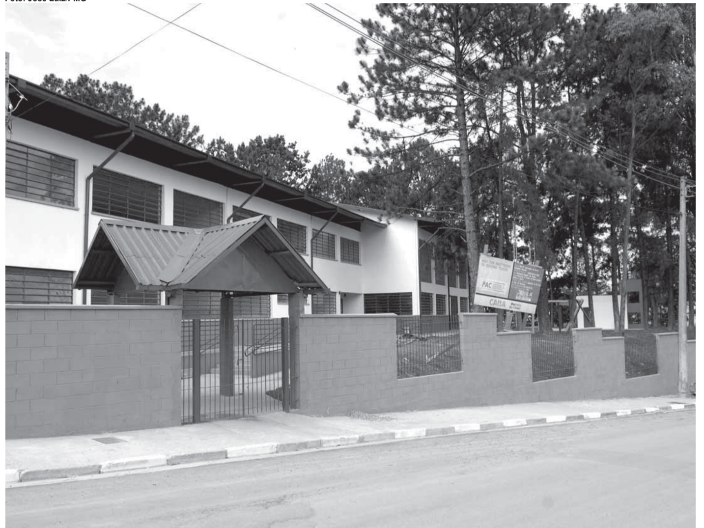
►Localizada na Vila Alzira, a escola Zuzu Angel tem 2 pavimentos e acomodará 500 crianças em 9 salas de aula