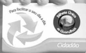
Terminal Urbano São João

A Prefeitura de Guarulhos vem transformando o transporte público com mais segurança, comodidade e economia. O Bilhete Único já beneficia cerca de 540 mil pessoas, que podem fazer até quatro integrações no período de duas horas pagando apenas uma passagem. E para facilitar o acesso à maior quantidade de linhas de ônibus, já foram entregues o Terminal de Transferência Bonsucesso, a nova rodoviária e três novos terminais urbanos: Cecap, Pimentas e São João. Iniciativas como essas fazem mais do que melhorar a mobilidade urbana. Elas direcionam o sistema de transportes para o futuro que Guarulhos precisa.