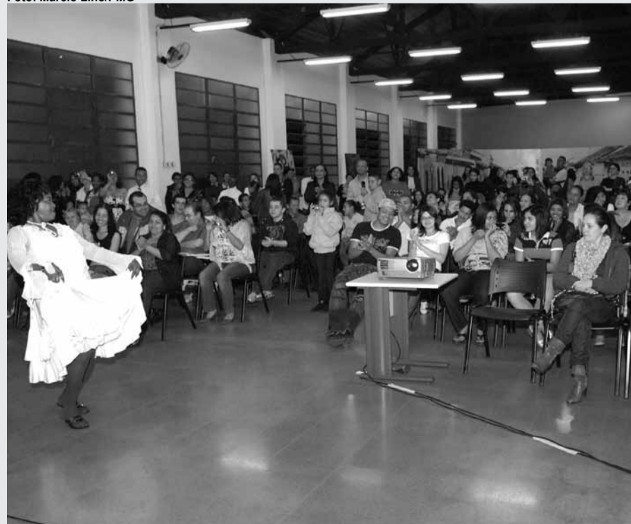
► Evento terá série de atividades como palestra, oficinas culturais e filmes