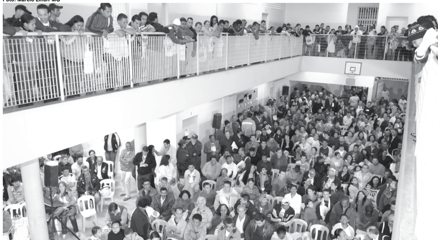
▶ Nos últimos dez anos, mais de 57 mil pessoas participaram das plenárias do Orçamento Participativo

população indicou 138 prioridades regionais e 42 para o município.