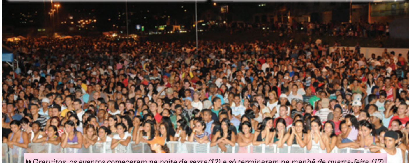
► Gratuitos, os eventos começaram na noite de sexta(12) e só terminaram na manhã de quarta-feira (17)