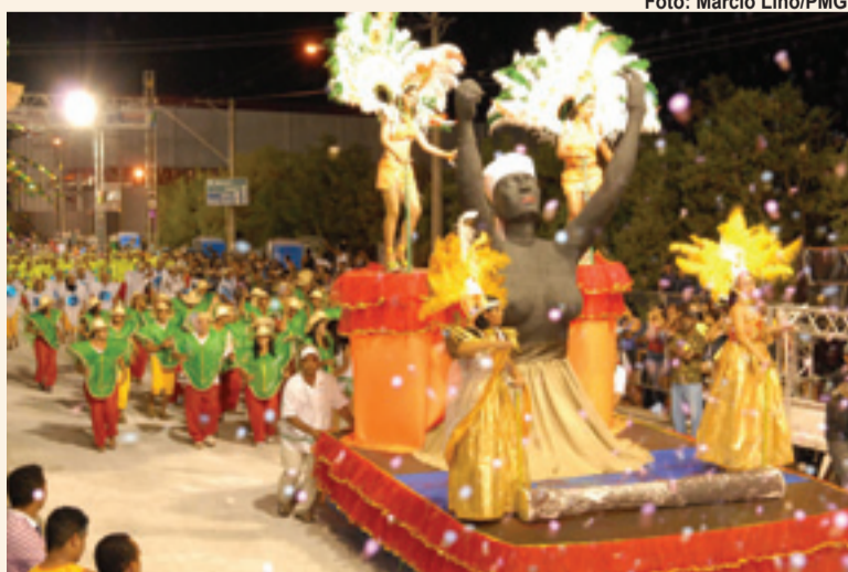
► Componentes da Vai Quem Fica e da Imperatriz do Morro levantaram a plateia