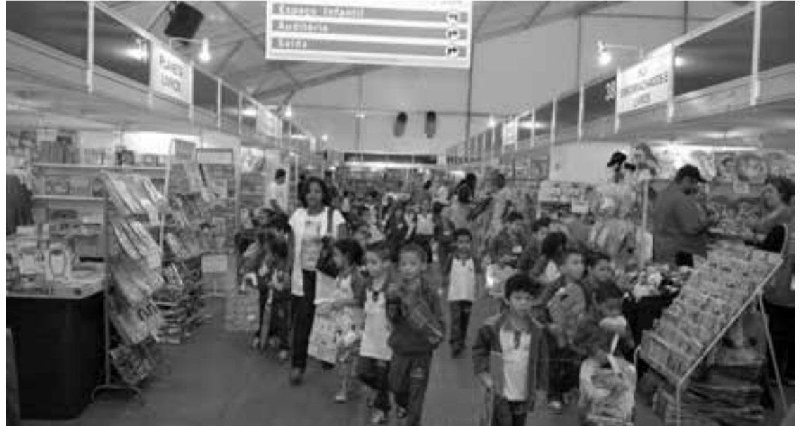
Salão do Livro traz à cidade milhares de pessoas e também escritores consagrados de todo o mundo

Nas últimas três edições, o Salão do Livro, que movimentou mais de 600 mil pessoas, trouxe à cidade importantes nomes da literatura nacional e