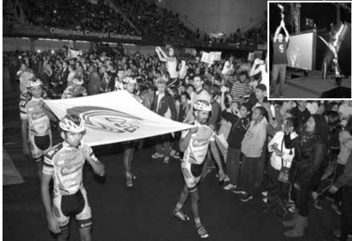
Jogador de vôlei Serginho (destaque) acendeu a pira olímpica na festa de abertura da 44ª OCG

futsal, handebol, natação, tênis, tênis de mesa, xadrez, damas, ginástica artística, atletismo, karatê, judô e capoeira. O atual campeão da OCG é o Colégio Eniac, que obteve 689 pontos na soma geral em 2013.