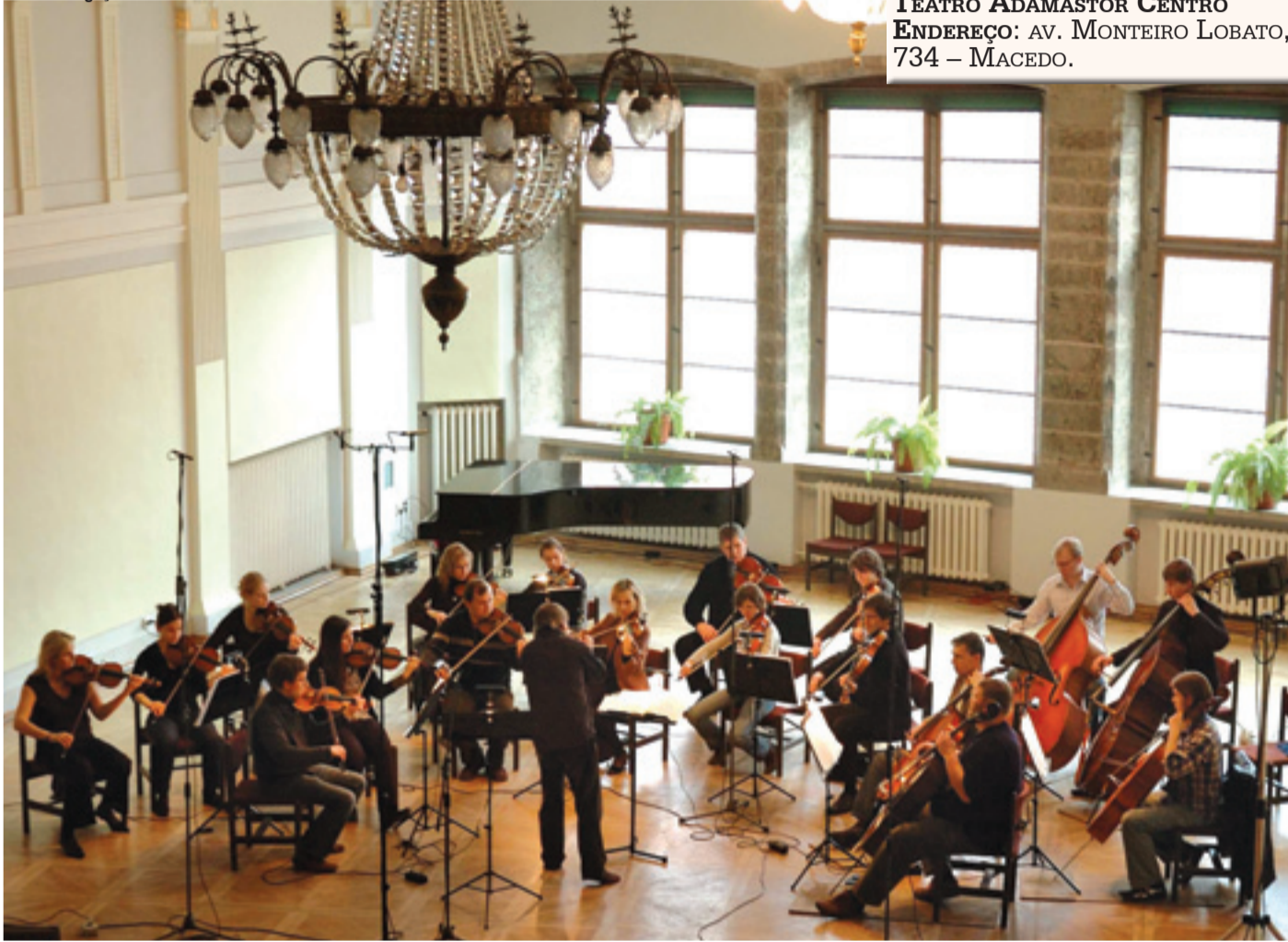
► Fundada em 1993, orquestra acumula a gravação de diversos CDs e exibições em turnês por vários países