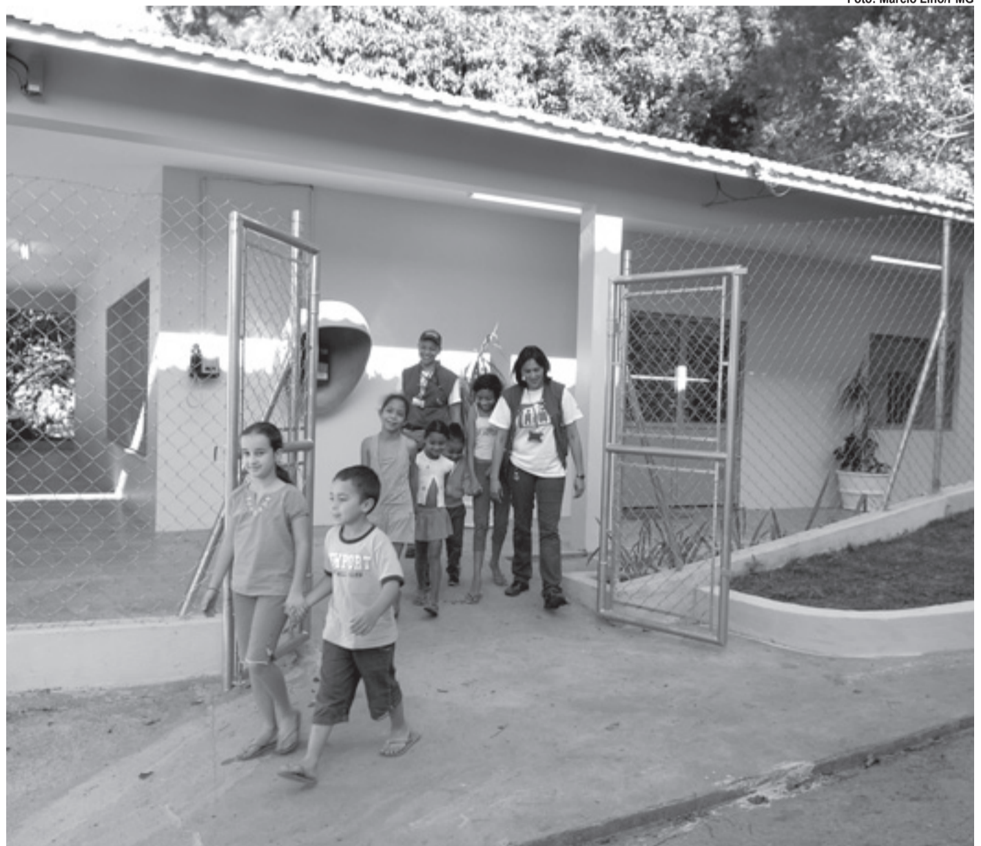
▶▶ Construído ao lado da Unidade Básica de Saúde, local também é aberto à população de bairros vizinhos

Além de beneficiar os moradores locais, o Centro de Convivência também é aberto a toda a população dos bairros vizinhos, como Jardim Palmira, Jardim Cambará, Parque Continental, Recreio São Jorge, Novo Recreio e Jardim Acácio. O espaço é dedicado ao atendimento de diversos grupos terapêuticos, como hipertensos, diabéticos, gestantes, adolescentes e crianças.