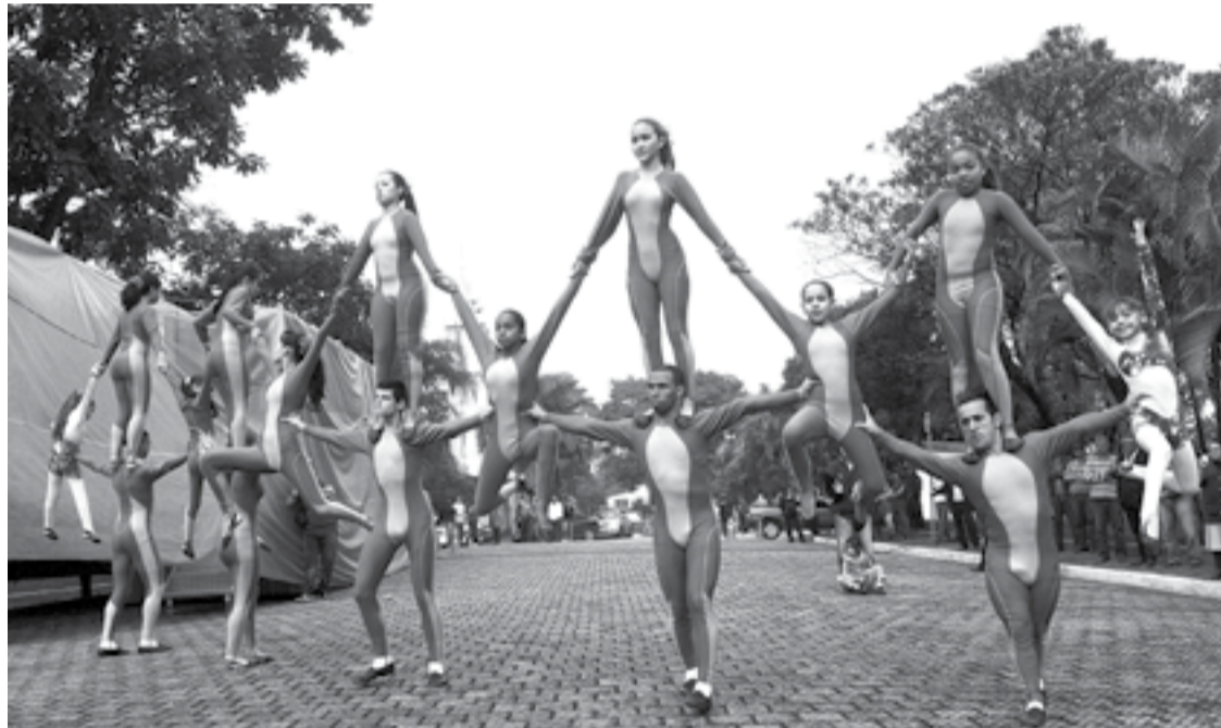
Programação para o servidor incluirá entre as atrações ginástica acrobática do grupo GIGGA