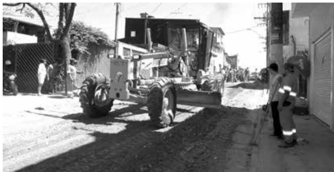
A rua Estevam Tavares, no Parque São Miguel, é uma das vias beneficiadas pelas obras de infraestrutura

Outros 3,3 km de recapamento estão sendo executados em trechos das avenidas Guarulhos, Antonio Iervolino e Chiyo Yamamoto, e das ruas