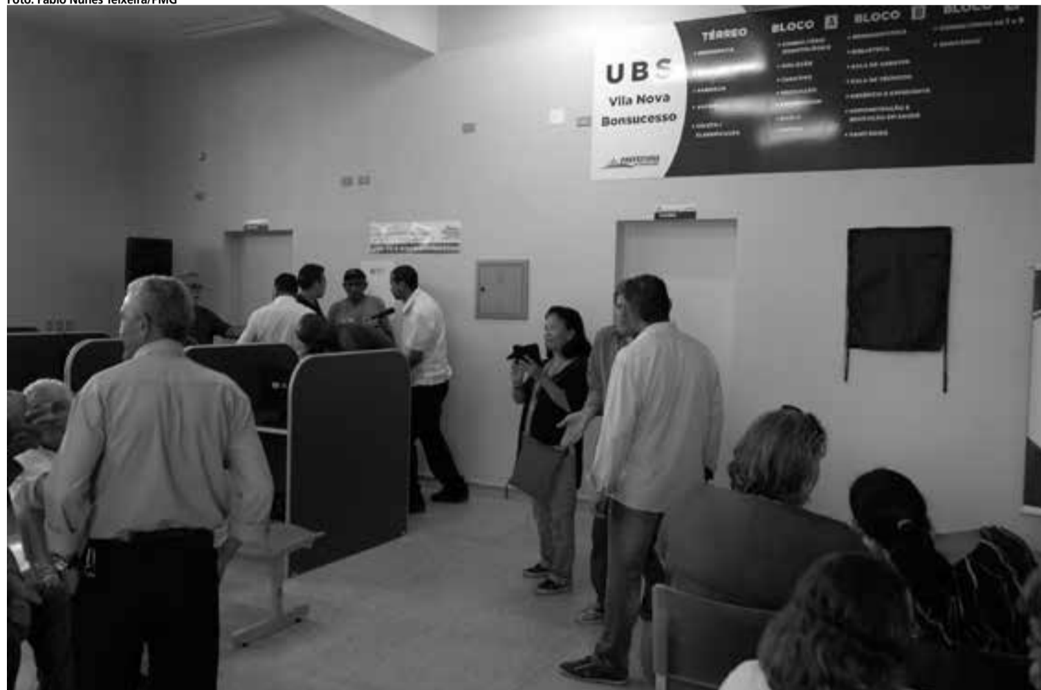
Nova UBS, com área construída de 1.000 m 2 , terá equipe com mais de 70 profissionais e vai beneficiar mais de 20 mil moradores

administrativo e, no térreo, o atendimento ao público.