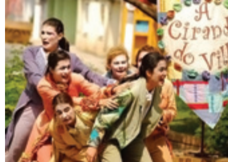
► Peça destaca figuras do folclore