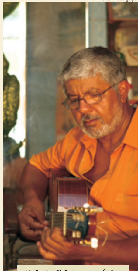
► Autodidata, o músico é considerado um dos melhores do Brasil