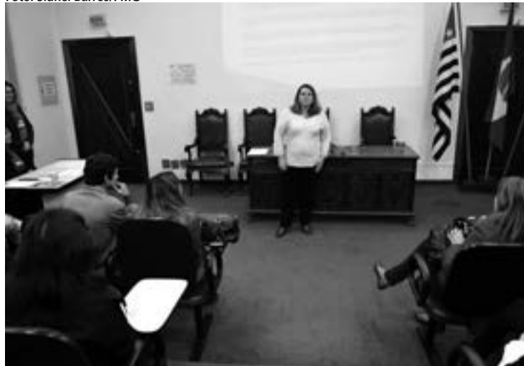
Profissionais da saúde são capacitados para usar os medicamentos

nais de saúde vão aprender a confeccionar composteiras domésticas, cujo húmus será usado nas hortas e canteiros.