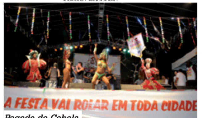
Pagode do Cebola