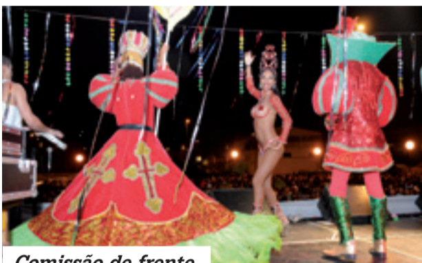
Comissão de frente

da Lira de Guarulhos, que reuniram no sábado e domingo, no salão do Adamastor do Centro, cerca de 5 mil pessoas, que puderam dançar e pular ao som de antigas marchinhas carnavalescas.