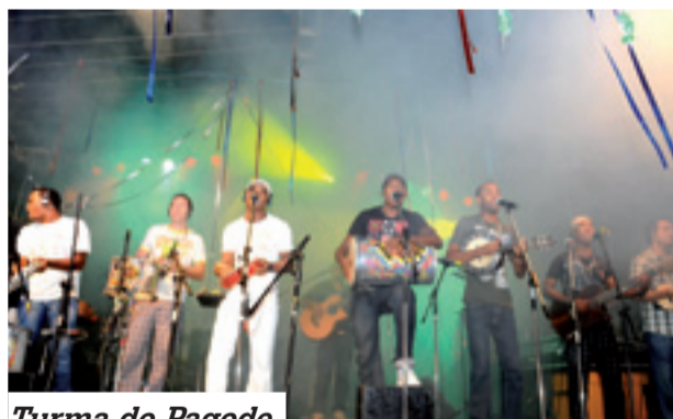
Turma do Pagode