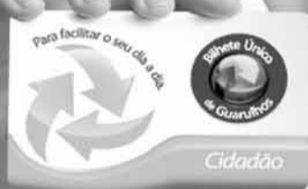
Terminal Urbano São João

A Prefeitura de Guarulhos vem transformando o transporte público com mais segurança, comodidade e economia. O Bilhete Único já beneficia cerca de 540 mil pessoas, que podem fazer até quatro integrações no período de duas horas pagando apenas uma passagem. E para facilitar o acesso à maior quantidade de linhas de ônibus, já foram entregues o Terminal de Transferência Bonsucesso, a nova rodoviária e três novos terminais urbanos: Cecap, Pimentas e São João. Iniciativas como essas fazem mais do que melhorar a mobilidade urbana. Elas direcionam o sistema de transportes para o futuro que Guarulhos precisa.