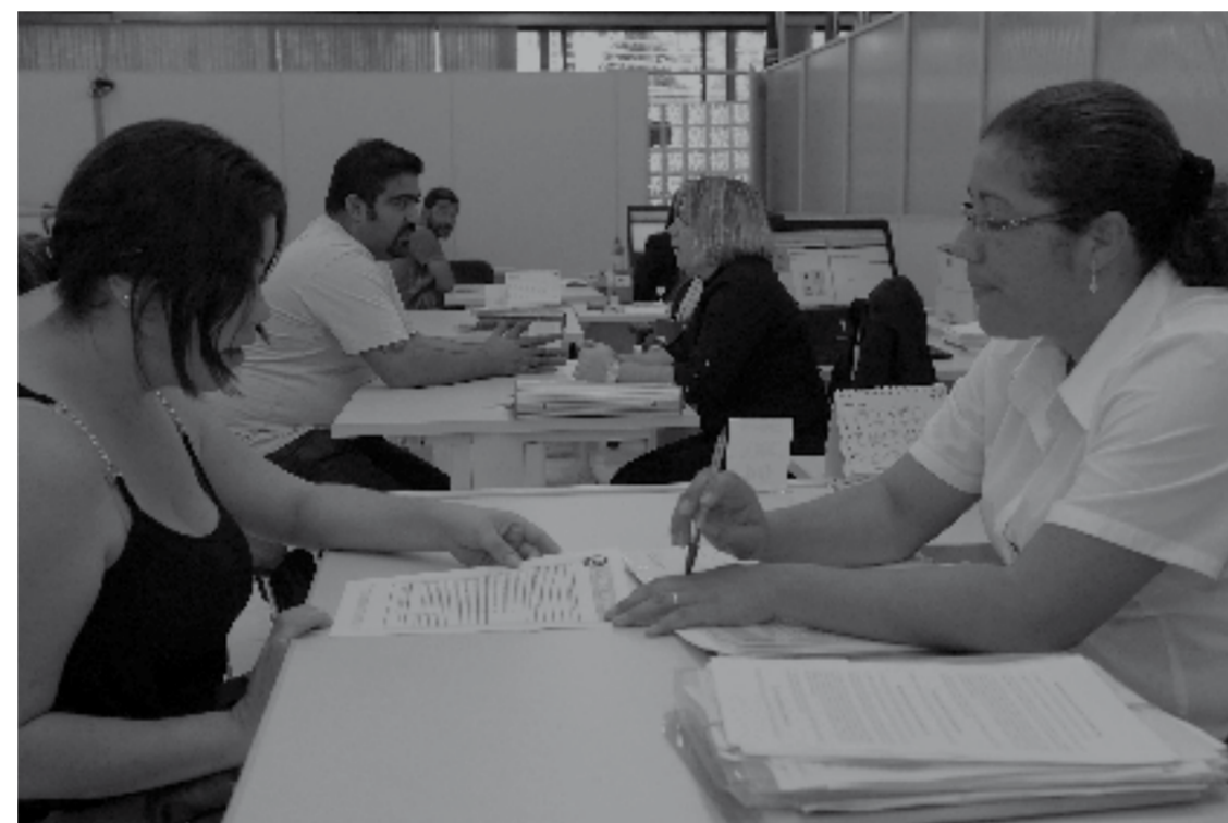
O Fácil Empresarial é a central de orientação para legalizar pequenos negócios

volume de serviço aumentar nos últimos dois anos. O motivo: a instalação de máquina de recebimento por meio de cartões de crédito e débito. "O movimento aumentou bastante. Antes era só no dia 5 e dia 20 que tinha mais mo-