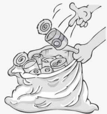
JOGUE NO LIXO TODO OBJETO QUE POSSA ACUMULAR ÁGUA