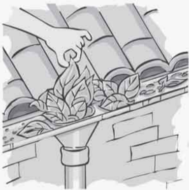
TIRE TUDO QUE POSSA IMPEDIR A ÁGUA DE CORRER PELA CALHA