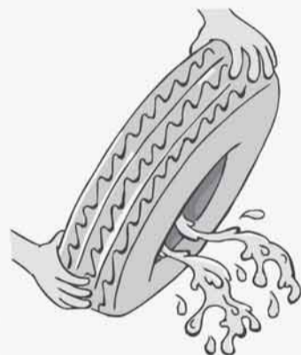
ENTREGUE PNEUS VELHOS NO POSTO DE RECIKLAGEM OU GUARDE-OS, SEM ÁGUA, EM LOCAL COBERTO