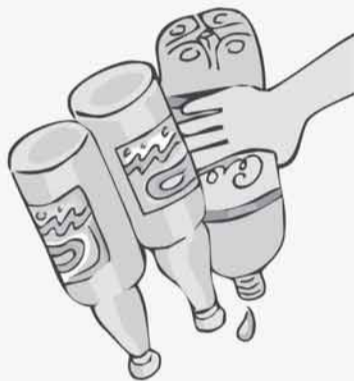
GUARDE GARRAFAS SEMPRE DE CABEÇA PARA BAIXO