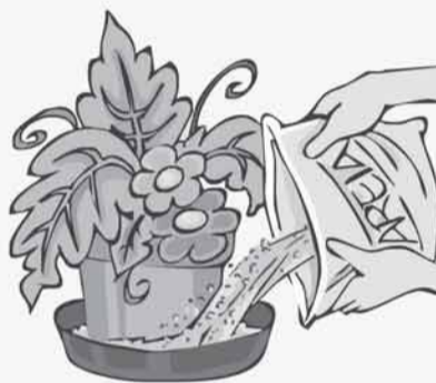
ENCHA DE AREIA OS PRATINHOS DAS PLANTAS