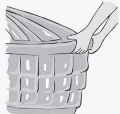
MANTENHA A CAIXA-D'ÁGUA BEM TAMPADA

Com a chegada das chuvas de verão, não deixe acumular água em recipientes como vasos e pratinhos de plantas, pneus, garrafas, tambores, etc. Mantenha sua caixa-d'água, os poços e/ou cisternas bem tampados.