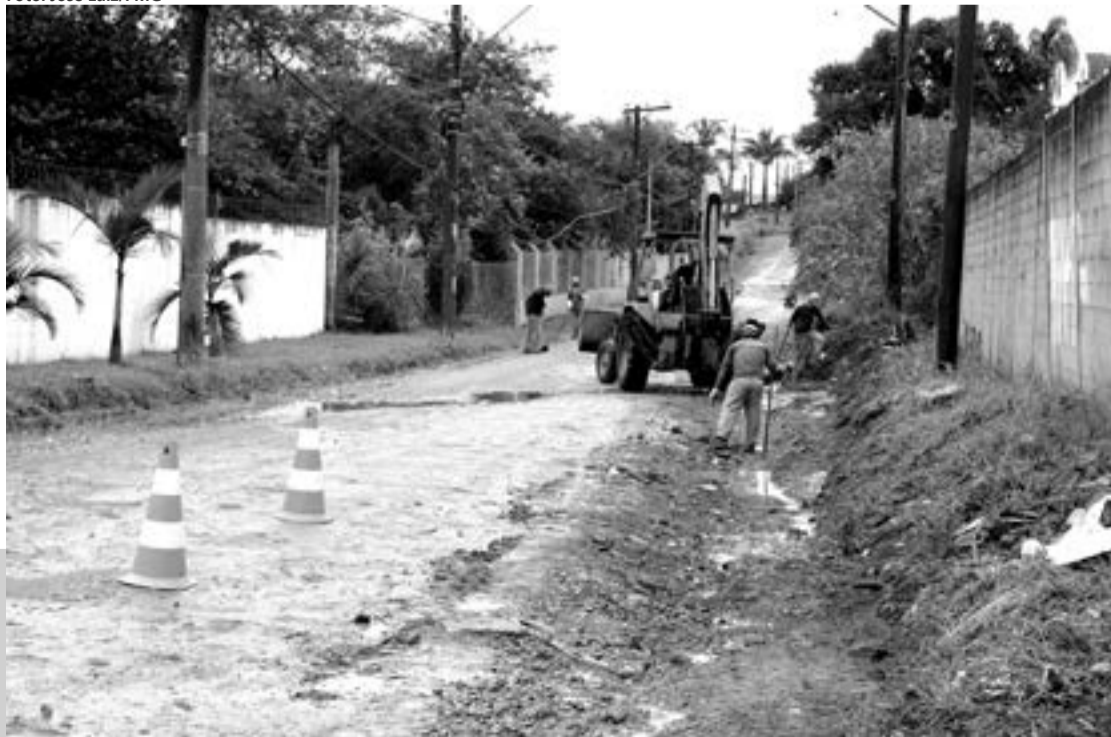
A rua Landri Salles (foto) é uma das beneficiadas com infraestrutura no Aracília