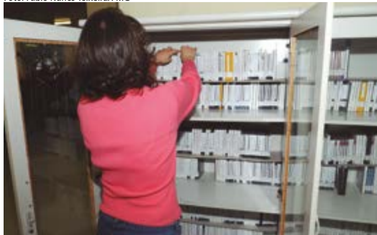
Acervo tem mais de 400 audiolivros, além de obras em Braille