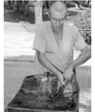
"Pica-pau" trabalha no Zoo

não dava para os estudos. Tentei voltar duas vezes," justifica Pica Pau que cursou até a 4ª série (5º ano do fundamental).