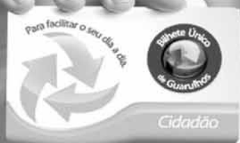
Terminal Urbano São João

A Prefeitura de Guarulhos vem transformando o transporte público com mais segurança, comodidade e economia. O Bilhete Único já beneficia cerca de 540 mil pessoas, que podem fazer até quatro integrações no período de duas horas pagando apenas uma passagem. E para facilitar o acesso à maior quantidade de linhas de ônibus, já foram entregues o Terminal de Transferência Bonsucesso, a nova rodoviária e três novos terminais urbanos: Cecap, Pimentas e São João. Iniciativas como essas fazem mais do que melhorar a mobilidade urbana. Elas direcionam o sistema de transportes para o futuro que Guarulhos precisa.