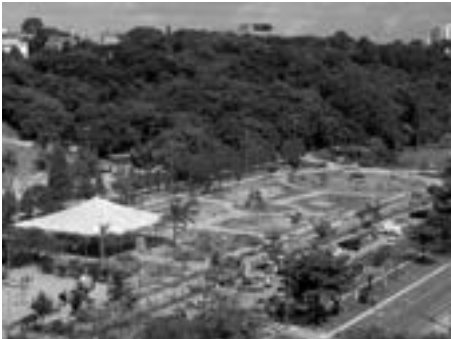
O Bosque Maia será área de atuação

A Secretaria de Meio Ambiente e o Conselho Gestor do Fundo Municipal de Meio Ambiente informam que estão abertas até o próximo dia 6 as inscrições para a seleção de entidades de Guarulhos para o Projeto Agente Ambiental Local.