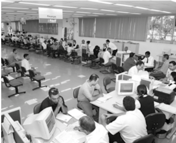
O serviço público é norteado pelo artigo 37 da Constituição

rio Público, motivado pela data da fundação do Departamento Administrativo do Serviço Público do Brasil e da publicação do Decreto nº 1.713.