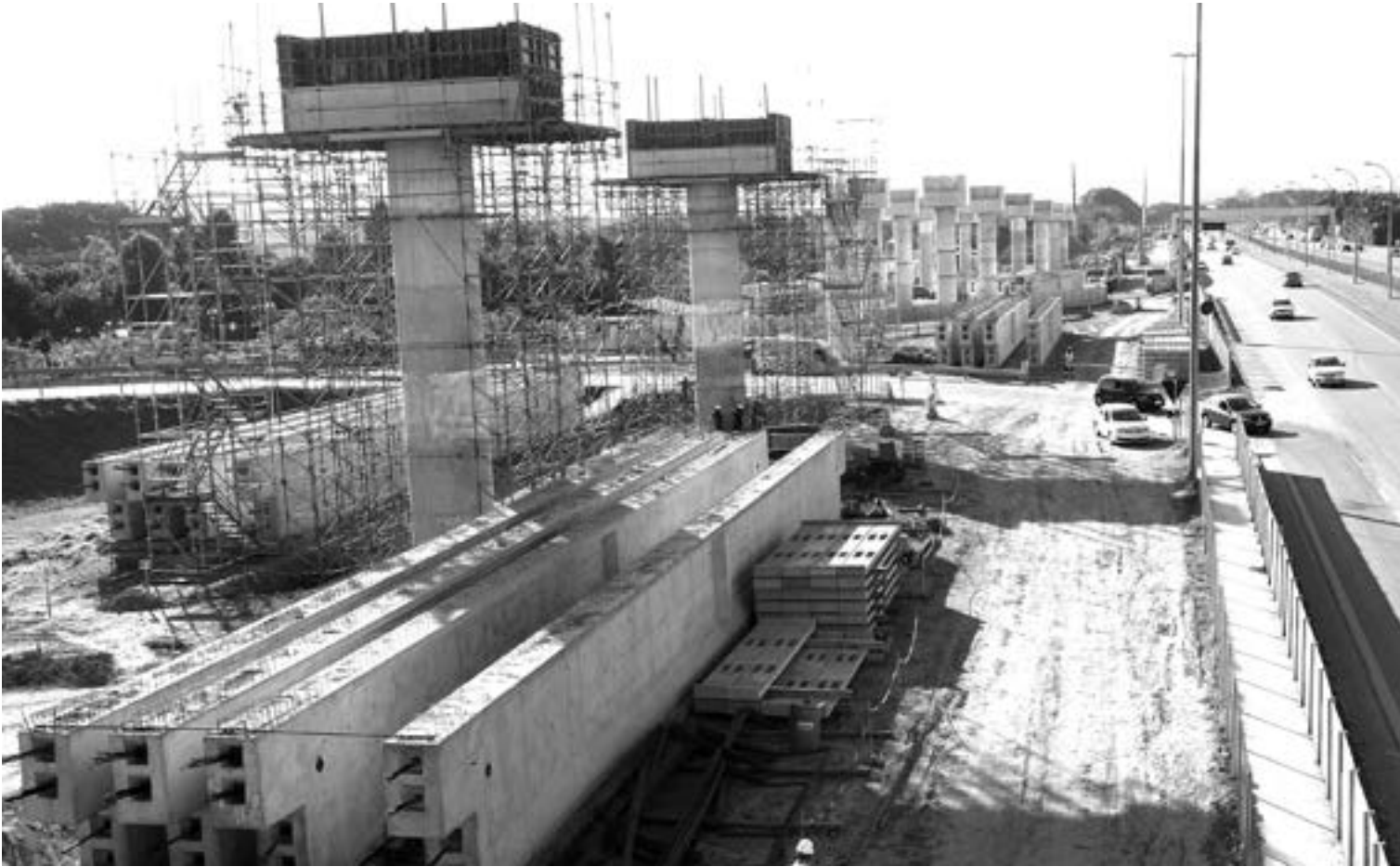
As obras da linha 13 - Jade eram para estar prontas e ligar o Aeroporto à Capital, mas agora podem chegar à região de Bonsucesso

Segundo a Prefeitura, uma das principais reivindicações é a inclusão de estações nas regiões do Presidente Dutra, Santos Dumont, São João e Bonsucesso no novo projeto.