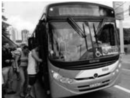
Estudantes terão mais opções de ônibus

Em razão das provas do Enem (Exame Nacional do Ensino Médio) neste sábado e domingo, dias 24 e 25, a Secretaria de Transportes e Trânsito elaborou uma operação especial de serviço em 22 linhas, com mais ônibus nos horários entre 9h e 12h, para atender aos estudantes.