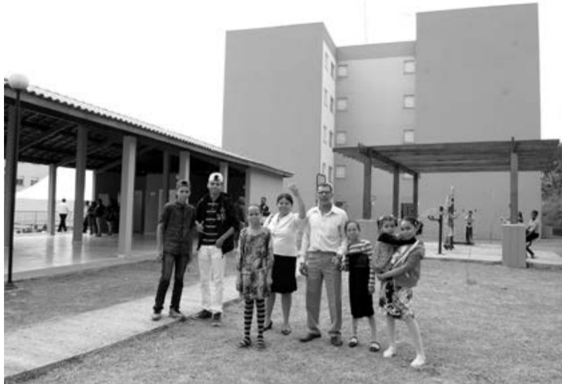
O complexo habitacional possui 25 blocos, com unidades de dois quartos com área total de 48,62 m²

com meus avós, sempre lutei muito e agora tenho um lugar só meu para morar", disse.