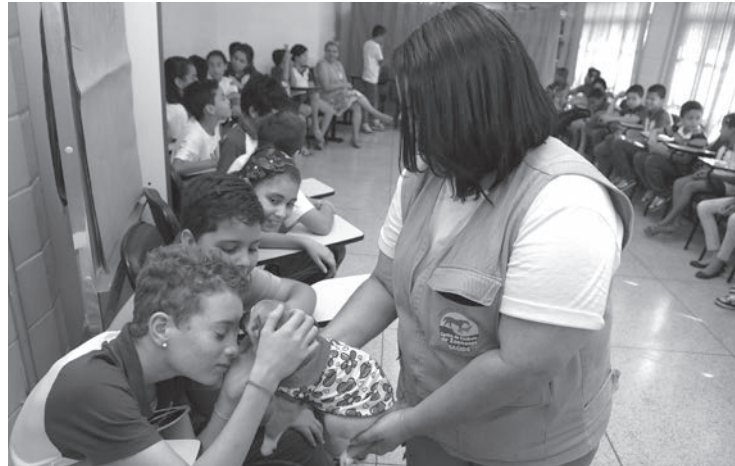
Os alunos adoram quando interagem com os mascotes do CCZ

É uma iniciativa para formar multiplicadores, e estimular a guarda responsável e o controle populacional dos animais domésticos. A programação permite aos estudantes conhe-