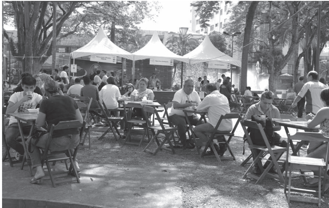
Vários sabores estarão seduzindo as pessoas que passarem pela praça Getúlio Vargas até sábado

O evento, coordenado pelo Departamento de Turismo, da Secretaria de Desenvolvimento Econômico, tem por objetivo promover e valorizar a gastronomia local em âmbito regional. Além disso, pretende incrementar a venda dos restaurantes e mostrar a qualidade dos serviços, com pratos bem elaborados.