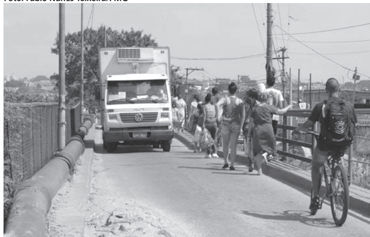
A situação precária da ponte afeta a vida de milhares de pessoas