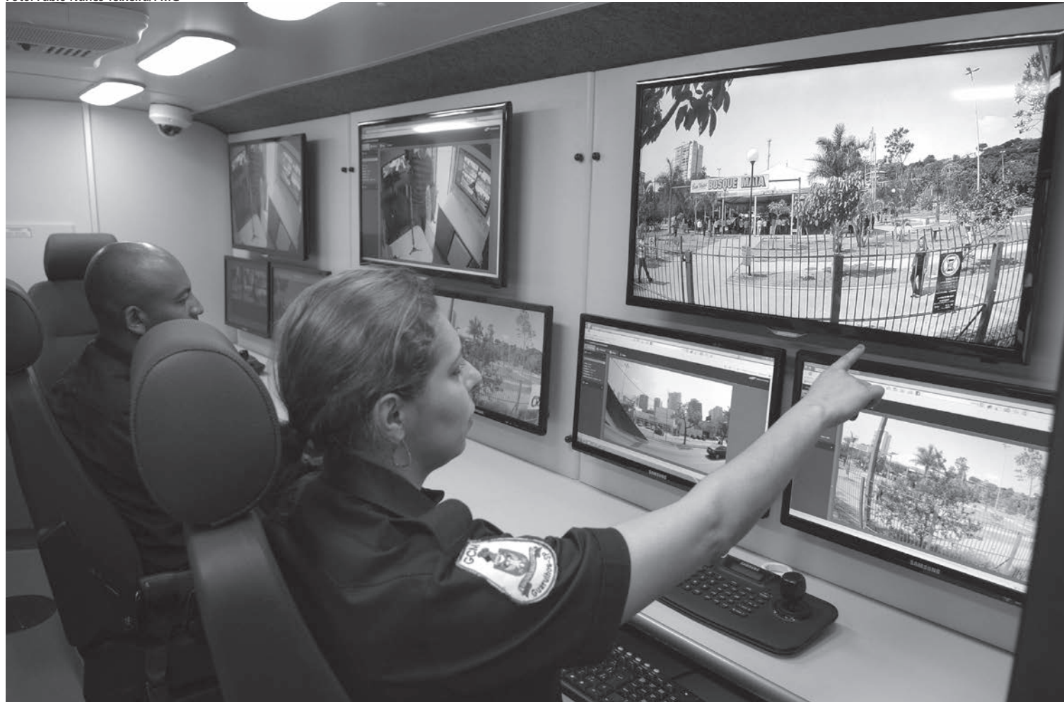
Combate às drogas terá maior monitoramento de áreas e integração entre efetivos da GCM e das polícias civil, militar e rodoviária