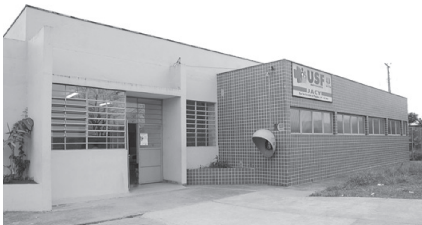
▶ A UBS do Jardim Jacy é uma das unidades que receberá os profissionais aprovados no processo seletivo

O processo seletivo terá três etapas: prova objetiva (marcada para 7 de fevereiro), prova prática (de caráter classificatório) e entrevista com análise curricular. O candidato deve acompanhar os editais pelo Diário Oficial de Guarulhos , que poderá ser acessado através do seguinte site: www.guarulhos.sp.gov.br