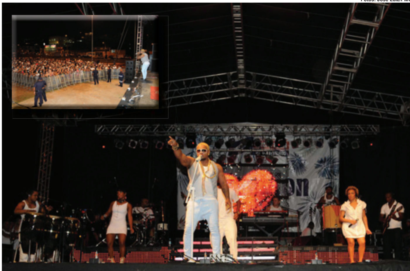
▶ Ex-vocalista do grupo Travessos, Rodriguinho foi uma das principais atrações do Réveillon na cidade

As mesmas atrações (com exceção das escolas de samba) também animaram a festa de Réveillon no Parque da Universidade, no Pimentas, que reuniu cerca de 40 mil pessoas. No local também houve queima de fogos e uma animada contagem regressiva para anunciar o Ano-Novo. Não foi registrado nenhum incidente nos dois locais.