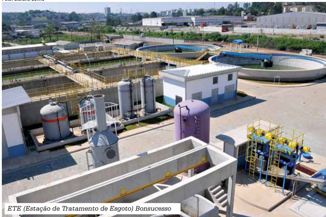
ETE (Estação de Tratamento de Esgoto) Bonsucesso