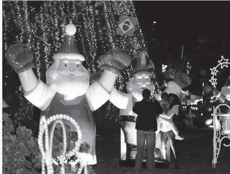
► Parque conta com Papai Noel para atender crianças e tirar fotografias