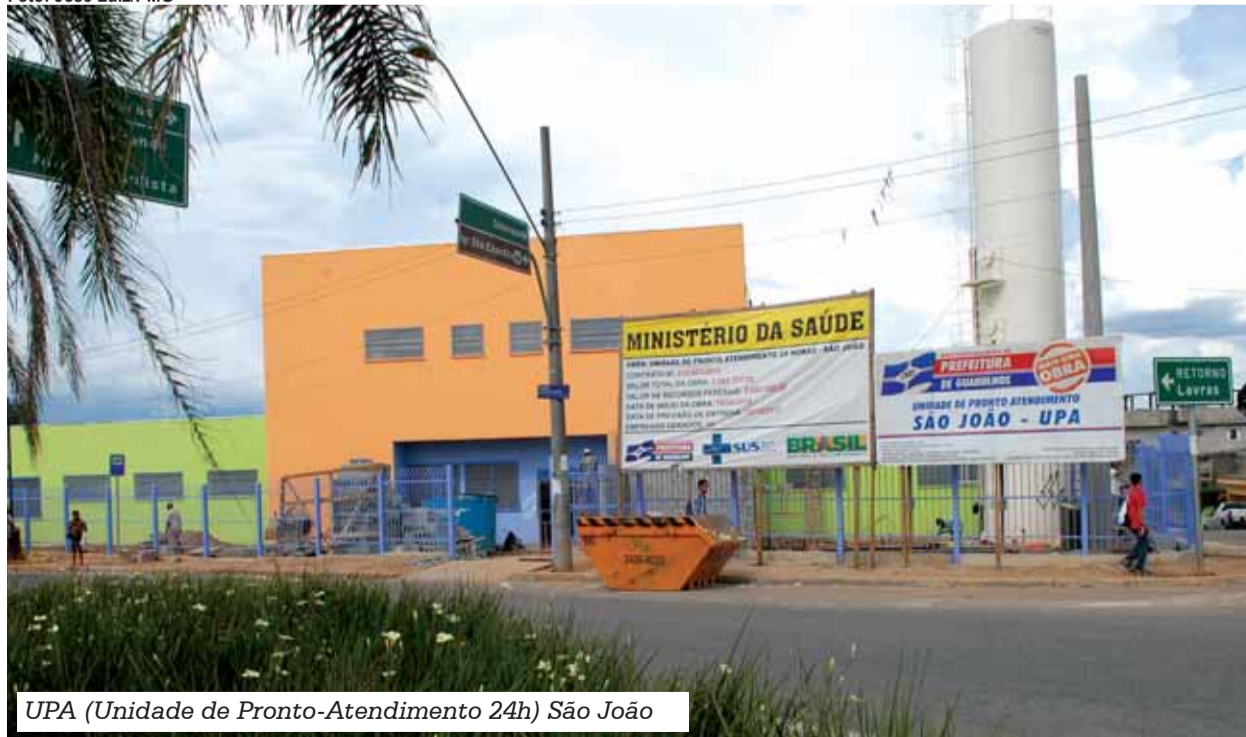
UPA (Unidade de Pronto-Atendimento 24h) São João