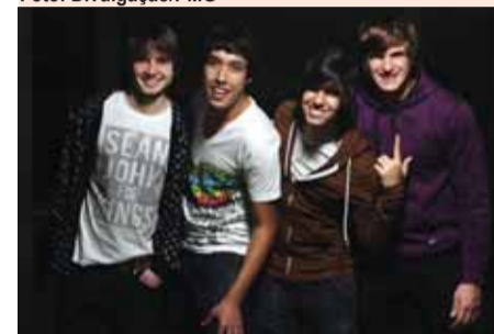
► Etna é sucesso entre internautas

No domingo (12), a partir das 14 horas, o pátio de eventos do Adamastor Centro abrigará um grande show com as bandas Etna e Stevens. O evento é resultado de uma parceria entre a Secretaria de Cultura e a Rádio 89 FM.