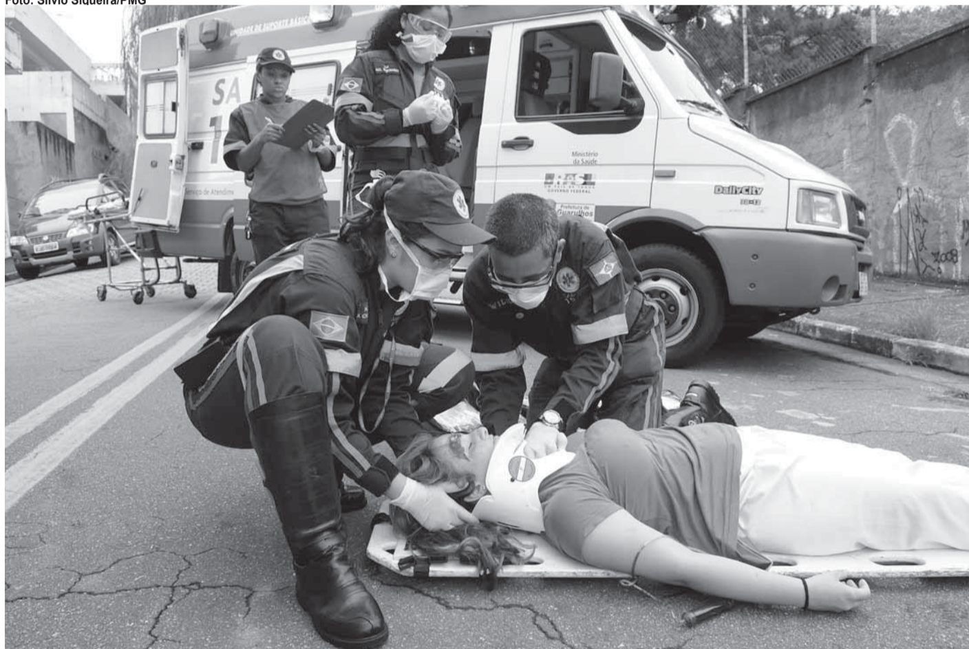
► Os profissionais do Samu utilizarão metodologia internacional para o atendimento de múltiplas vítimas

Uma gestante que estará passando pelo local irá se deparar com o ocorrido e perceber que o motorista da Van é seu marido. Em estado de choque, a mulher entrará em trabalho de parto e seu bebê irá nascer com a ajuda