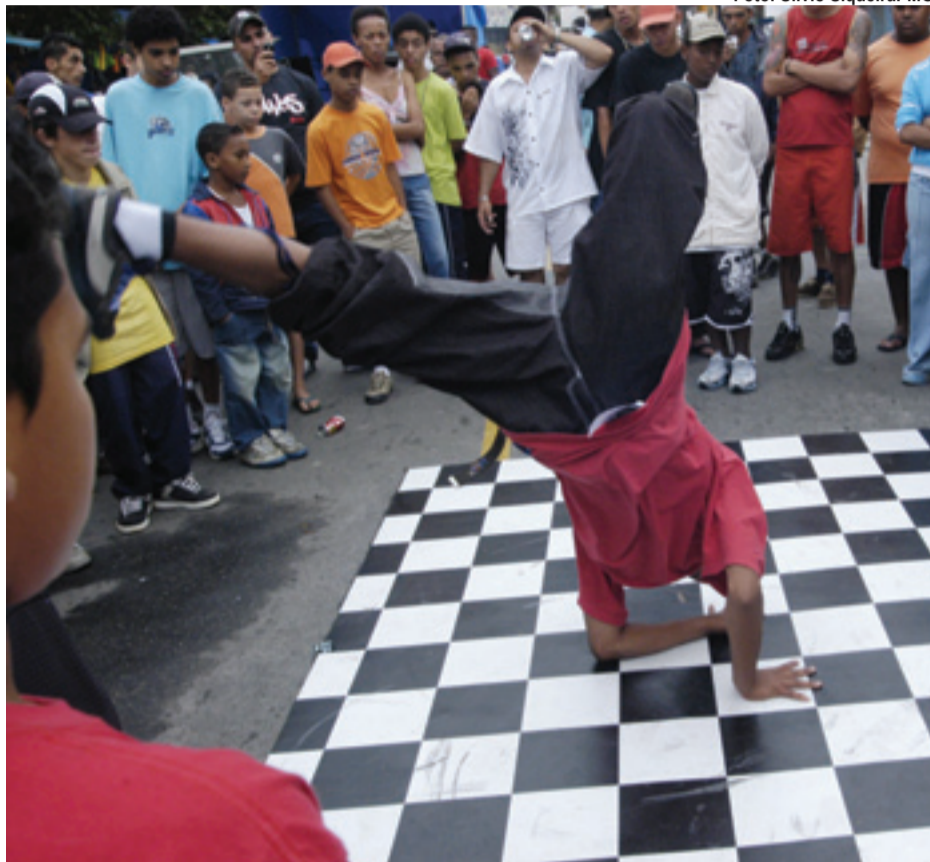
▶ São esperados cerca de 1.900 participantes no Adamastor Centro

Diadema e Guarulhos. No total, serão cerca de 1.900 participantes, entre 1.430 da Mostra, 320 delegados do Fórum, além de 100 convidados e 30 voluntários (veja programação no site www.guarulhos.sp.gov.br ).