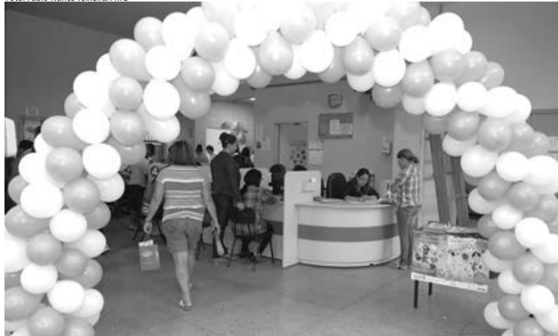
Além dos atendimentos habituais, serão oferecidos serviços como sessões de massagem e embelezamento

doença somente será completa depois da terceira dose, administrada após cinco anos. A vacina protege em 70% a incidência do câncer de colo de útero, e também previne contra verrugas genitais causadas pelo papilomavírus.