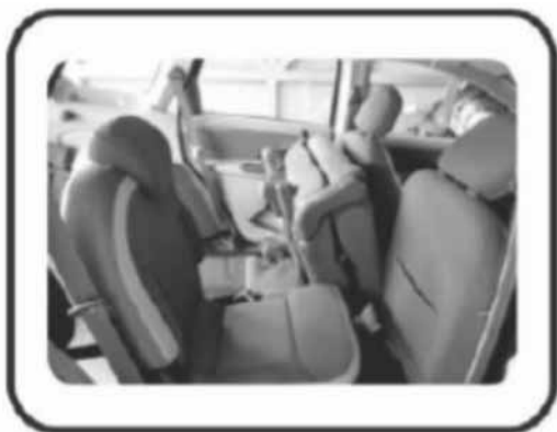
LAY-OUT ILUSTRATIVO DO TÁXI ACESSÍVEL

8. Bancos para o acompanhante: Deverão ser utilizados os bancos originais do veículo, adaptados para oferecerem regulagem, retração e escamoteamento.