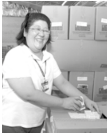
Selma: movida pela curiosidade