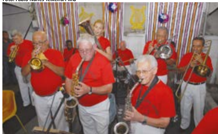
No dia 7, a Banda Bixcha (à esq.) mostrará a alegria de 39 folias; na mesma data, a Banda Lira participa do desfile do Bloco Samba do Sino