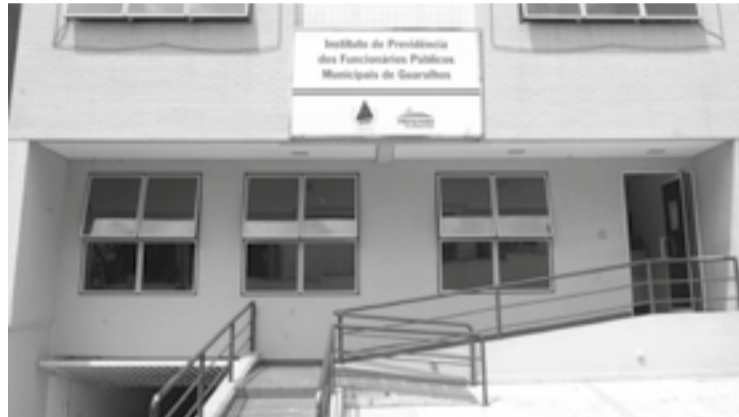
O Ipref treinou os agentes de RH para auxiliar no processo

de trabalho, para tratamento de assuntos particulares (LIP) e aqueles que estiverem em suspensão e em suspensão preventiva por alegada incapacidade laborativa.