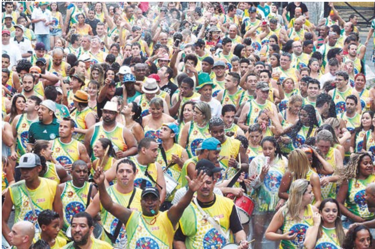
O Bloco do Asinha abre a Folia de Momo neste sábado (31), partindo da Vila São Jorge em direção ao Centro, a partir das 14 horas