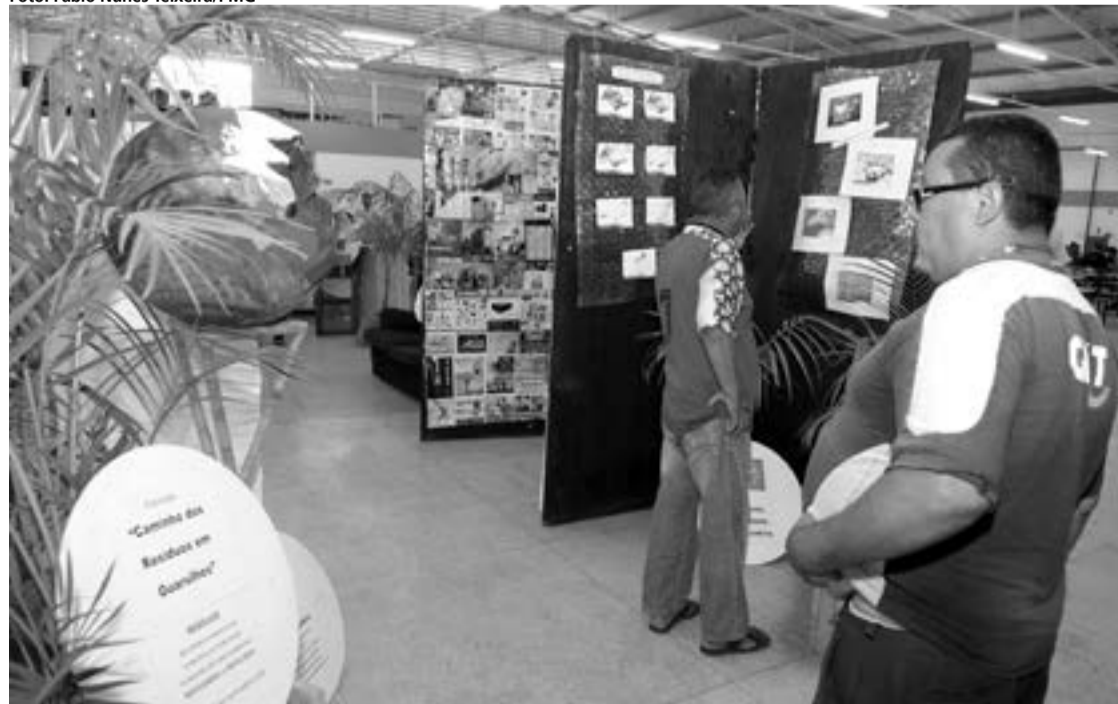
Mostra "Caminho dos Resíduos em Nossa Cidade" está no Restaurante Popular do Taboão